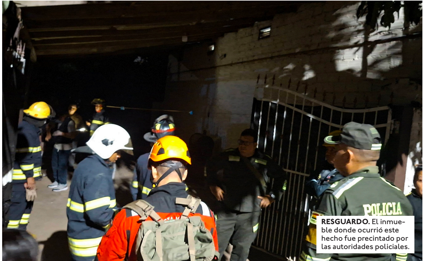
RESGUARDO. El inmueble donde ocurrió este hecho fue precintado por las autoridades policiales.

LA MADRE DE UNA VÍCTIMA INDICÓ QUE SU HIJO SOLO DABA EL SERVICIO DE TRANSPORTE A LAS PERSONAS QUE ALQUILABAN EL CUARTO.