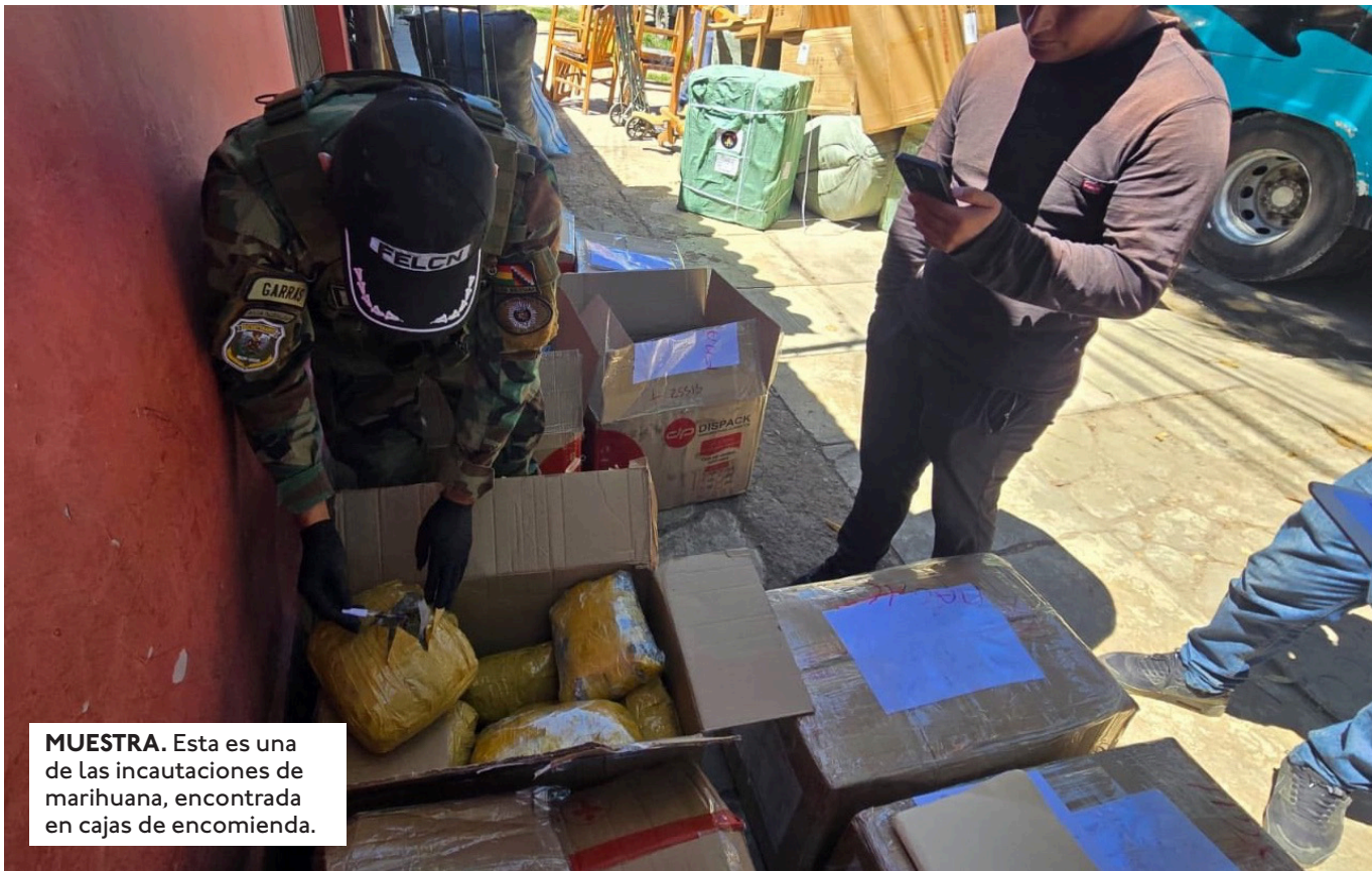
MUESTRA. Esta es una de las incautaciones de marihuana, encontrada en cajas de encomienda.

EL VICEMINISTRO JUSTINIANO SENTENCIÓ QUE CON ESTOS OPERATIVOS "NO HAY ESPACIO PARA LA ILEGALIDAD. NI FUERA, NI DENTRO".