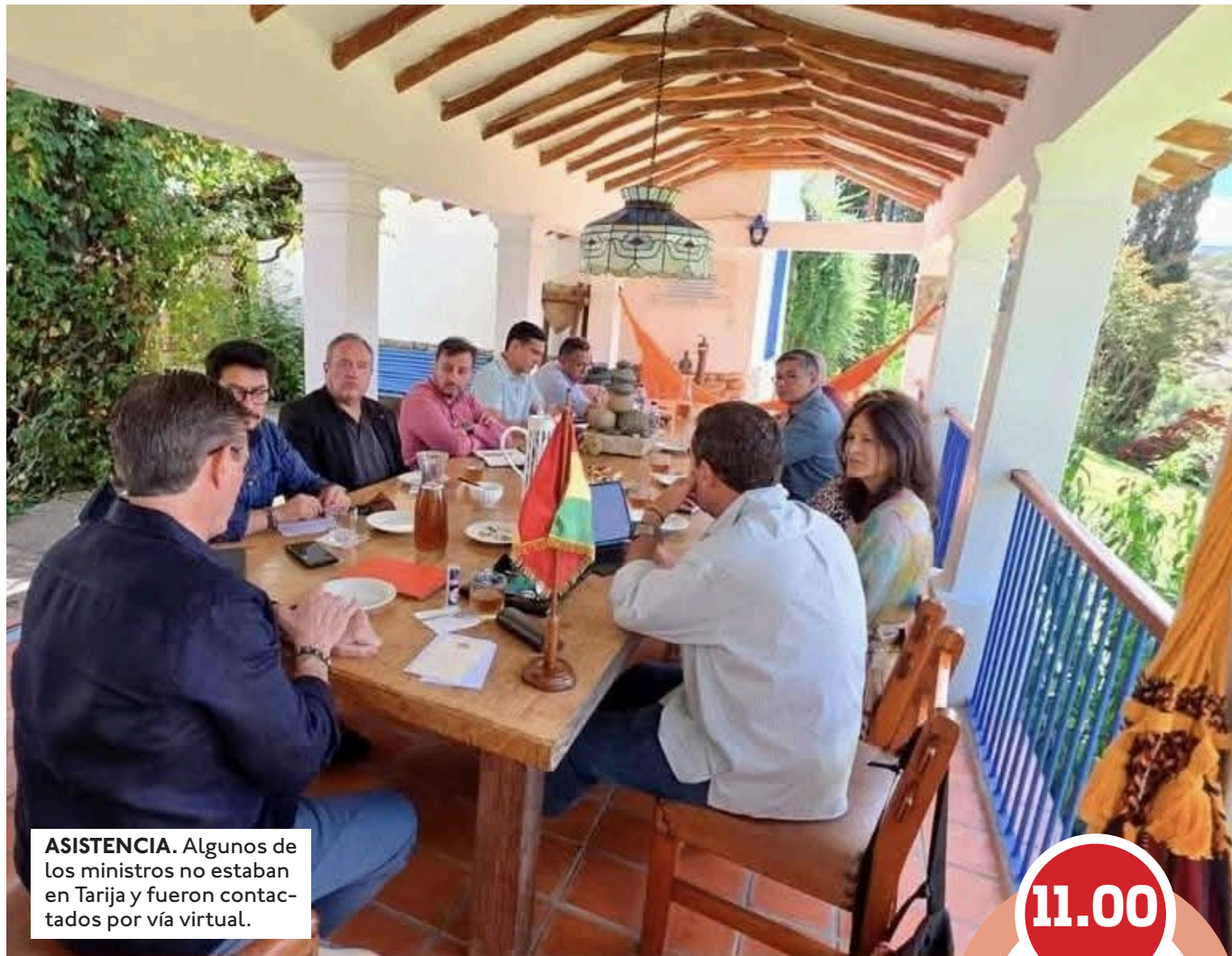
ASISTENCIA. Algunos de los ministros no estaban en Tarija y fueron contactados por vía virtual.

Varias leyes aprobadas. Una vez que algunos proyectos de ley ya fueron sancionados por la Asamblea Legislativa Plurinacional, el presidente Paz tiene en sus manos la promulgación de normas que terminarán por ejemplo con el ITF, un impuesto vigente desde 2006 que grava las operaciones realizadas en moneda extranjera (dólares) con el 0,30 por mil. La anulación de este impuesto fue uno de los primeros anuncios de la administración del Gobierno nacional. El ministro de Economía, José Gabriel Espinoza, aseguró que era un impuesto que encarecía las operaciones en moneda extranjera, desincentivaba el ingreso de divisas y tenía una incidencia mínima en la recaudación. Otra ley lista para su promulga-