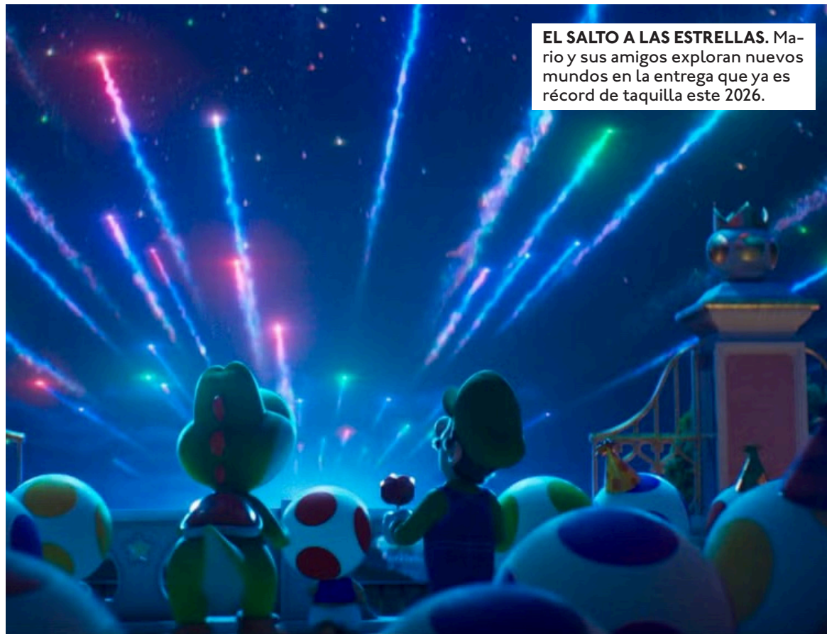
EL SALTO A LAS ESTRELLAS. Mario y sus amigos exploran nuevos mundos en la entrega que ya es récord de taquilla este 2026.

De la Tierra a las estrellas: El salto narrativo. A diferencia de la primera entrega, que se centraba en el Reino Champiñón, esta secuela nos lleva a las profundidades del