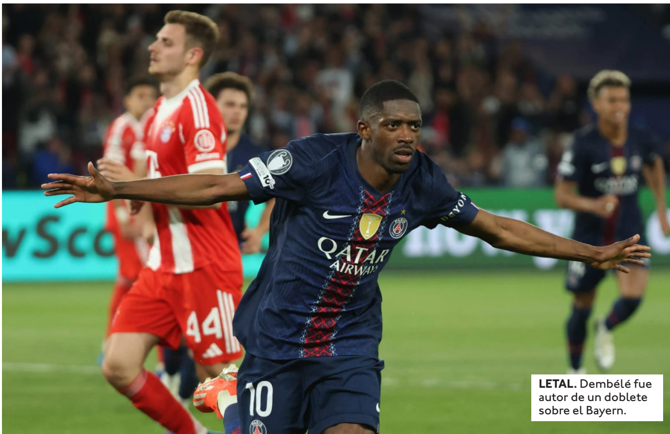
LETAL. Dembélé fue autor de un doblete sobre el Bayern.

“EL BAYERN ES UN EQUIPO DE PRIMERA CATEGORÍA. HA SIDO UN PARTIDO INCREÍBLE, Y AHORA IREMOS A MÚNICH EN BUSCA DE LA VICTORIA”.