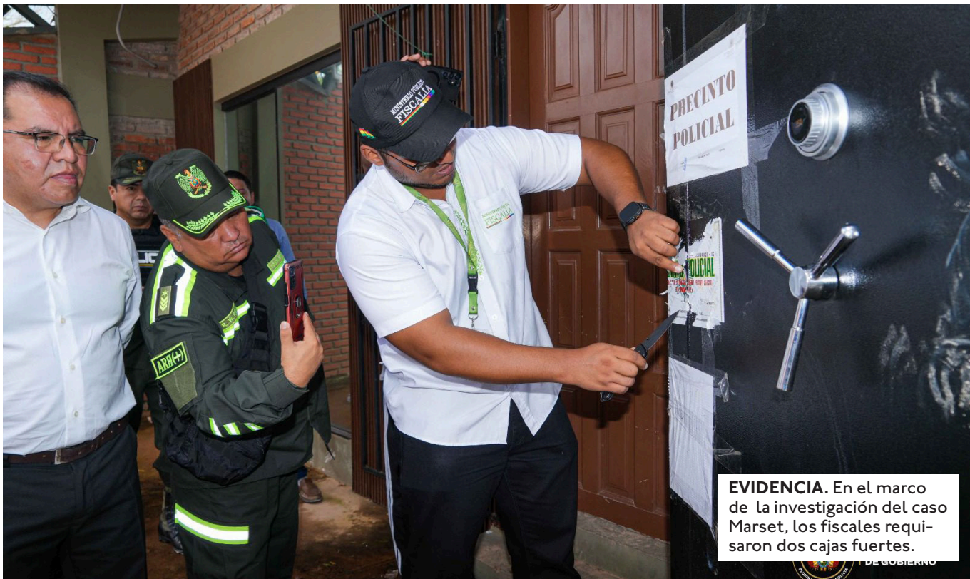
EVIDENCIA. En el marco de la investigación del caso Marset, los fiscales requirieron dos cajas fuertes.

SE REVELÓ PRESUNTAS AMENAZAS DE MUERTE CONTRA UNA FISCAL, SU ASISTENTE Y DOS POLICÍAS QUE PARTICIPAN EN LA INVESTIGACIÓN DE ESTE CASO RELACIONADO CON MARSET.