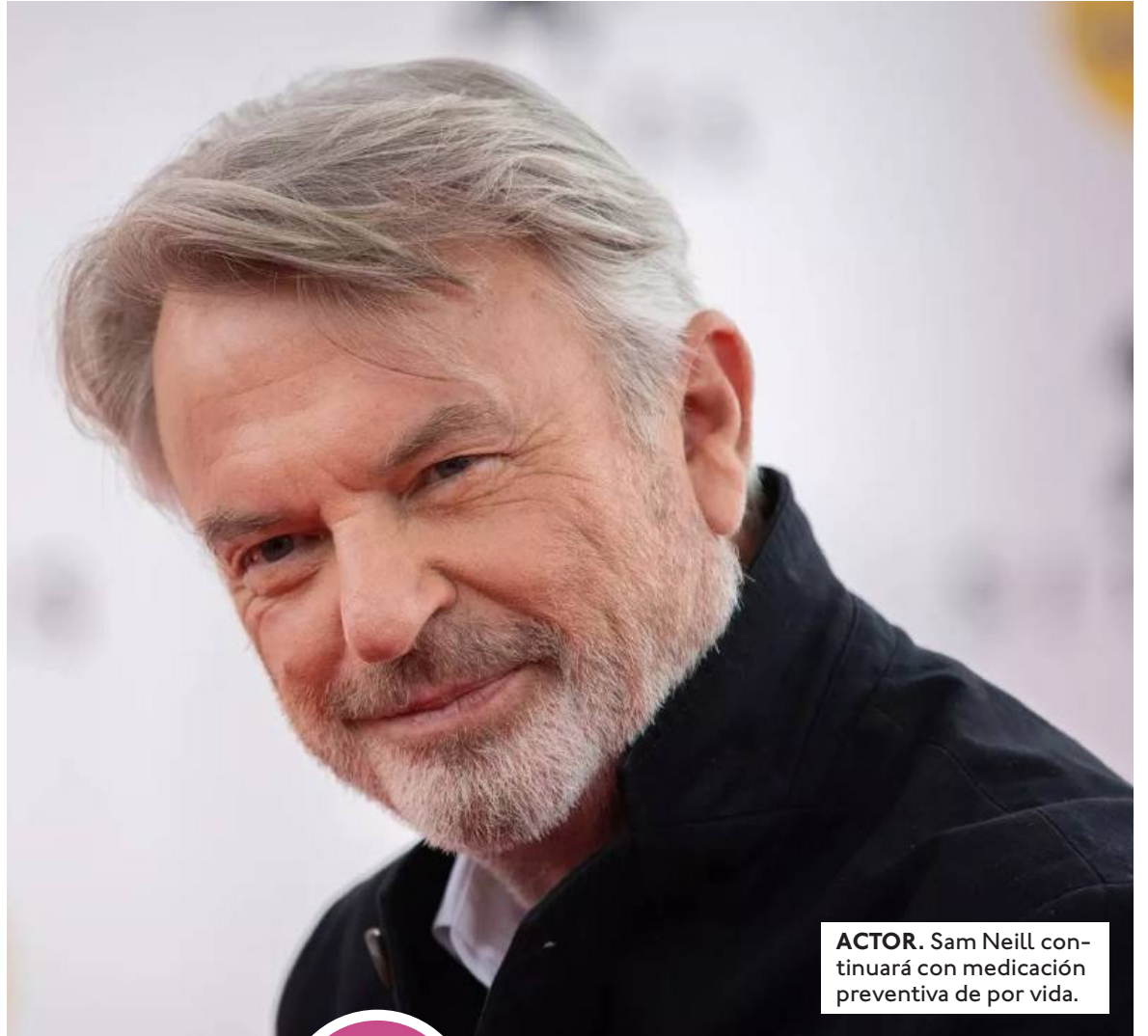
ACTOR. Sam Neill continuará con medicación preventiva de por vida.

Un tratamiento experimental clave. La clave de su recuperación ha sido un fármaco experimental al que se somete de forma quincenal. Aunque Neill deberá continuar con este tratamiento por el resto de su vida para mantener a raya la enfermedad, los médicos aseguran que su respuesta ha sido excepcional. El actor destacó que, a pesar de los efectos secundarios que a veces le restan energía, el simple hecho de poder despertar cada mañana y trabajar en su granja es el mayor regalo que ha recibido. Durante su batalla, Sam Neill nunca dejó de lado su sentido del humor ni su pasión por la actua-