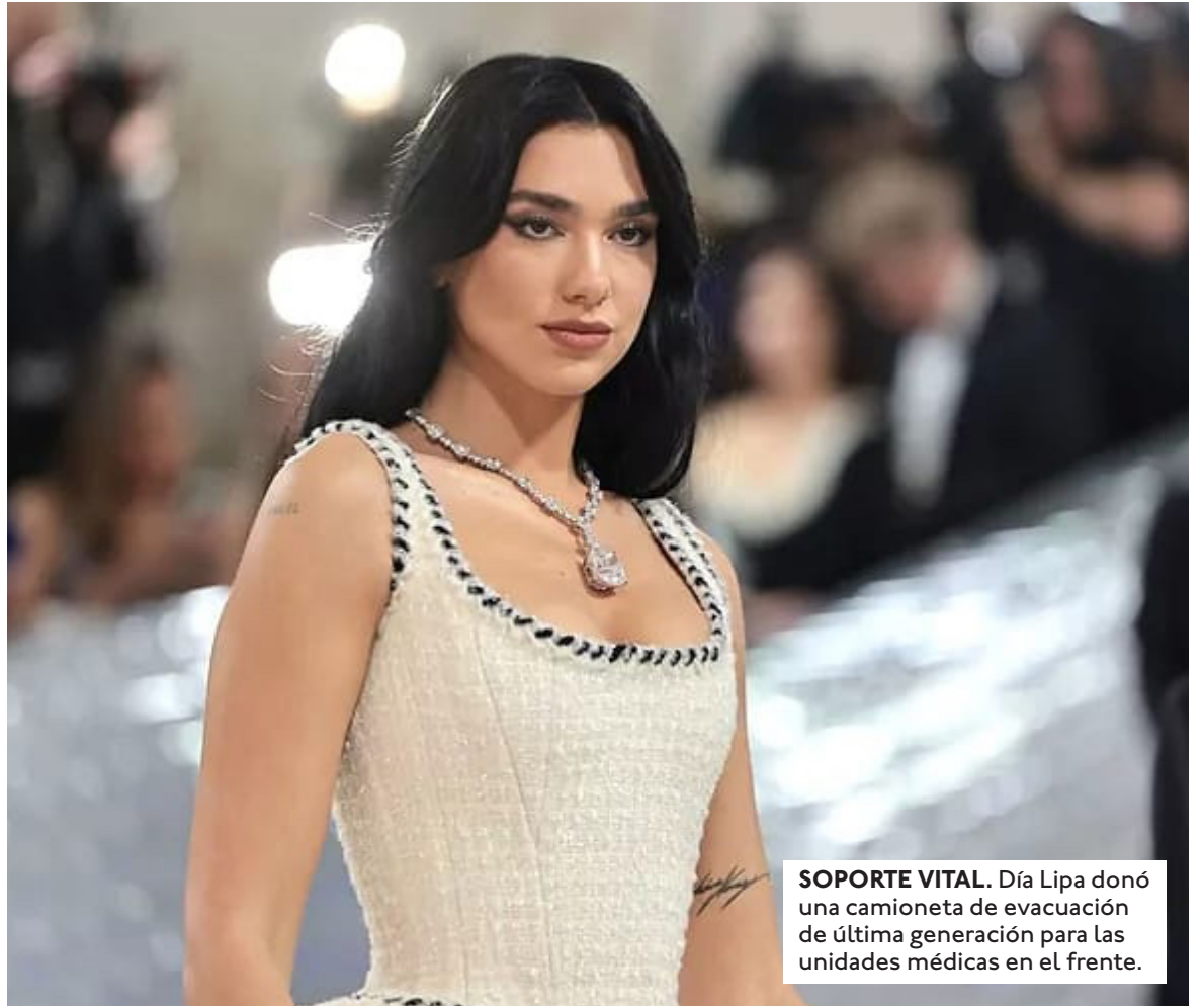
SOPORTE VITAL. Dua Lipa donó una camioneta de evacuación de última generación para las unidades médicas en el frente.

La estrella global del pop, Dua Lipa, ha trascendido las listas de éxitos musicales para realizar una contribución directa en la zona de conflicto en Ucrania. Este miércoles 22 de abril, un grupo de médicos militares ucranianos hizo público un video de agradecimiento dirigido a la intérprete de "Levitating", tras recibir una camioneta de evacuación médica (medevac) donada personalmente por la artista. El vehículo, equipado con tecnología de soporte vital, ya ha sido desplegado en una de las regiones más críticas del frente. La donación se gestionó de manera discreta a través de organizaciones humanitarias con las que la cantante colabora habitualmente. Según el testimonio de los médicos que recibieron el equipo, esta camioneta es fundamental para las operaciones de rescate, ya que su blindaje ligero y tracción permiten acceder a terrenos de difícil alcance donde las ambulancias convencionales no pueden operar. "Este regalo nos ayudará a salvar decenas de vidas cada semana", expresaron los uniformados en el clip viralizado en redes sociales.