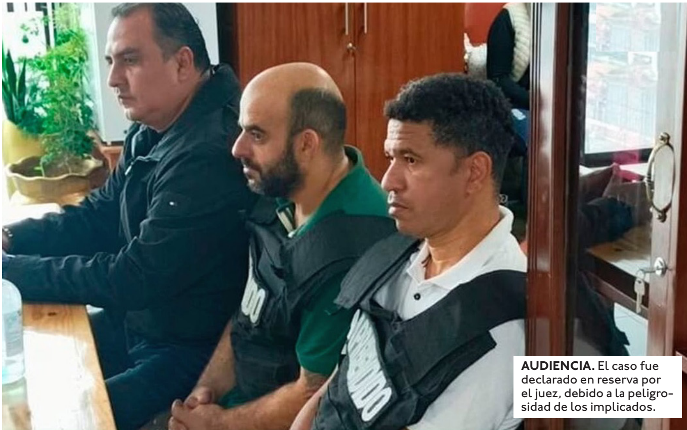
AUDIENCIA. El caso fue declarado en reserva por el juez, debido a la peligrosidad de los implicados.

EL CASO ESTARÍA RELACIONADO CON LA PRESUNTA DESAPARICIÓN DE UNA TONELADA DE DROGA, EN UNA CASA DEL URUGUAYO SEBASTIÁN MARSET.