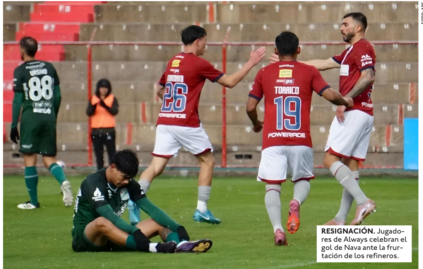
RESIGNACIÓN. Jugadores de Always celebran el gol de Nava ante la frustración de Los refineros.

EL DELANTERO DE ORIENTE CONFIRMÓ EN SUS REDES SOCIALES QUE REAPARECERÁ EL DOMINGO, CUANDO RECIBAN A REAL POTOSÍ DESDE LAS 19:30.