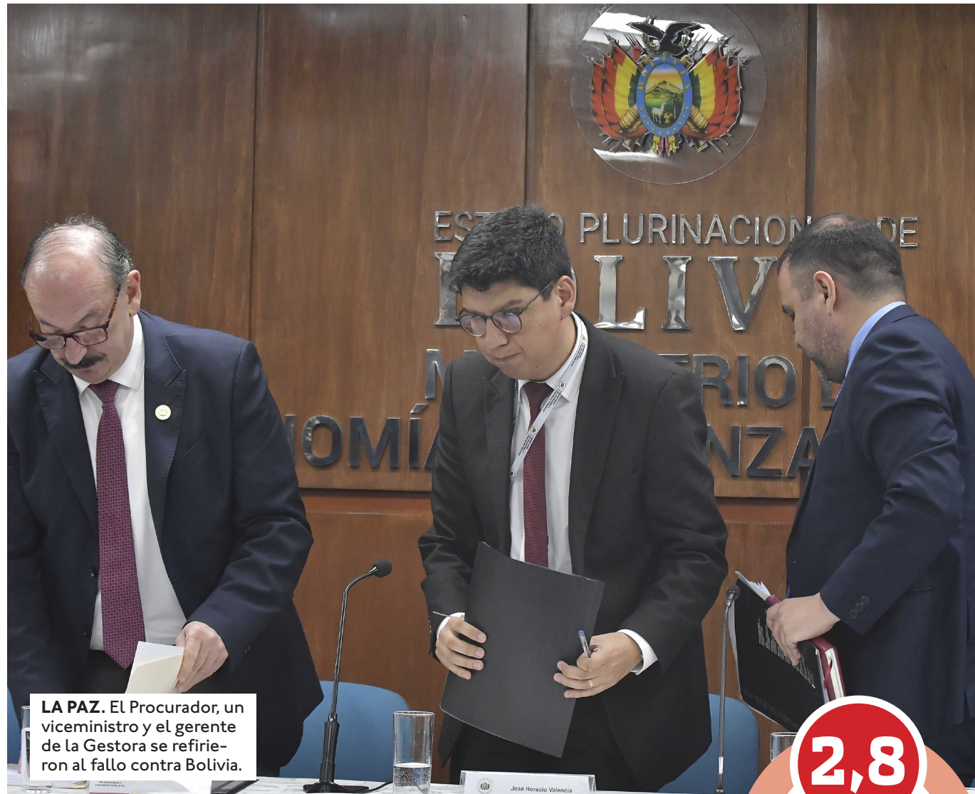
LA PAZ. El Procurador, un viceministro y el gerente de la Gestora se refirieron al fallo contra Bolivia.

Descartan afectación al fondo de pensiones. El cumplimiento de esta obligación judicial no afectará los aportes de jubilación de los trabajadores ni las rentas que reciben los jubilados. "El resultado del laudo arbitral no va a afectar a las pensiones (...). Los recursos que son administrados por la Gestora son un patrimonio autónomo; son independientes, son privados y tienen un destino