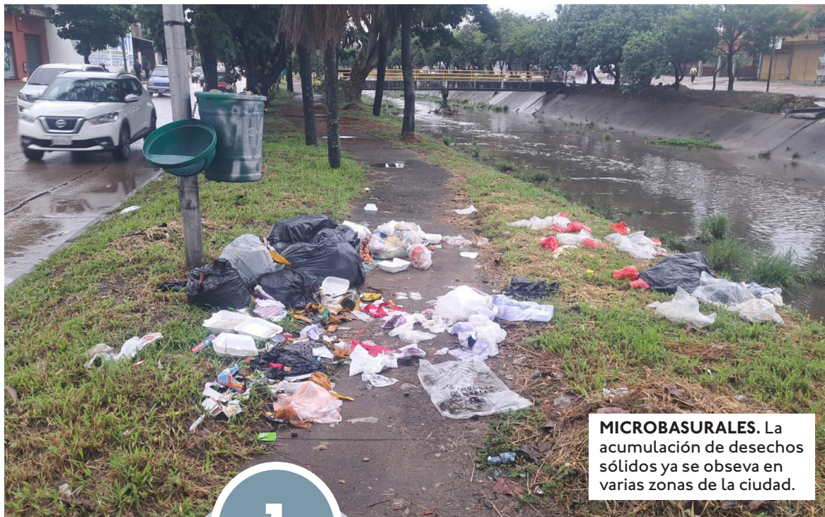
MICROBASURALES. La acumulación de desechos sólidos ya se observa en varias zonas de la ciudad.