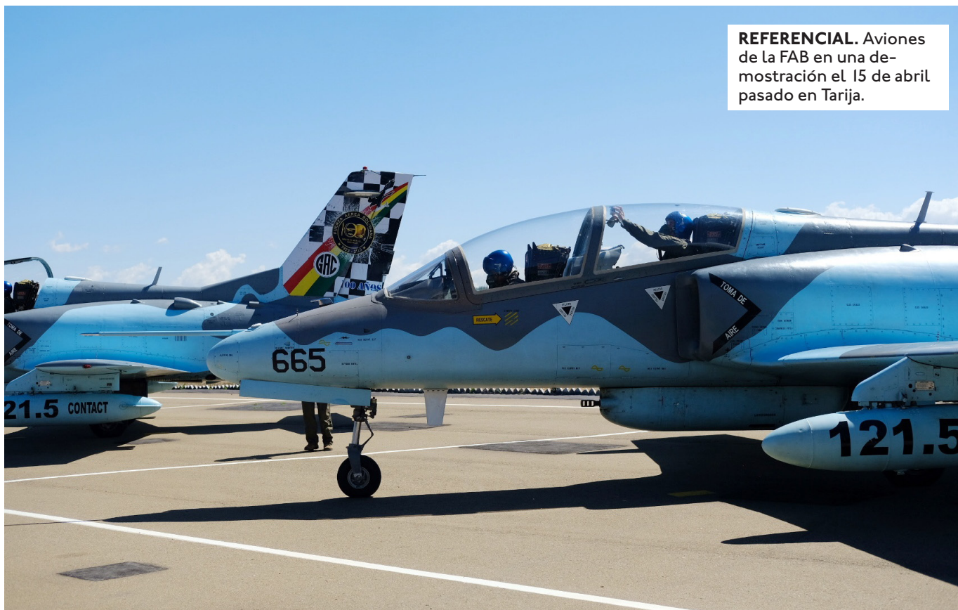
REFERENCIAL. Aviones de la FAB en una demostración el 15 de abril pasado en Tarija.

EL MINISTRO DE DEFENSA INFORMÓ QUE SE CUMPLE EL PAGO A FAMILIARES DE VÍCTIMAS DEL SINIESTRO DEL AVIÓN CON BILLETES EN EL ALTO EL 27 DE FEBRERO DE 2026.