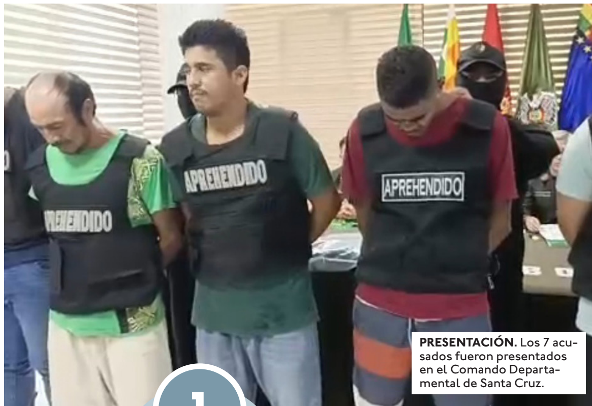
PRESENTACIÓN. Los 7 acusados fueron presentados en el Comando Departamental de Santa Cruz.

Según los indicios, los implicados conocían el momento exacto