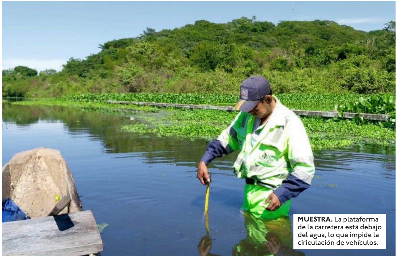
MUESTRA. La plataforma de la carretera está debajo del agua, lo que impide la circulación de vehículos.

EL SEDCAM INFORMÓ QUE SE PUEDE TRANSITAR EN LA RUTA A LOS VALLES CRUCEÑOS CON PRECAUCIÓN, DURANTE LA SEMANA SANTA.