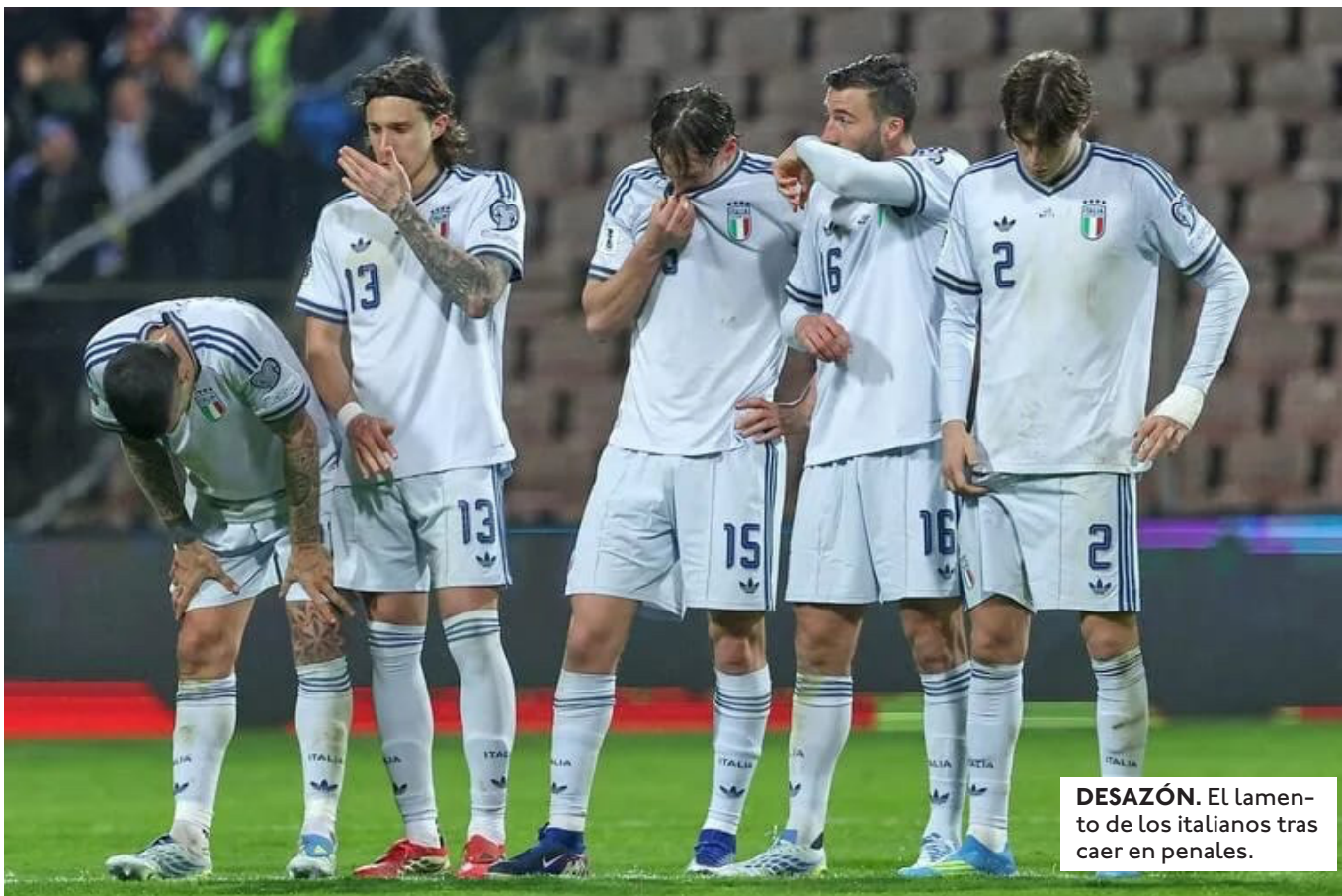
DESAZÓN. El lamento de los italianos tras caer en penales.

TURQUÍA LOGRÓ SU PASE AL MUNDIAL TRAS VENCER A KOSOVO POR 1-0. REPÚBLICA CHECA DERROTÓ A DINAMARCA EN PENALES (3-1).