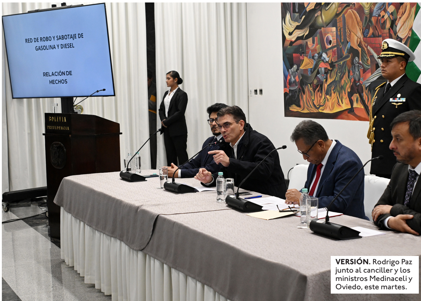
VERSIÓN. Rodrigo Paz junto al canciller y los ministros Medinaceli y Oviedo, este martes.