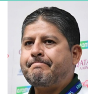
Óscar Villegas SELECCIONADOR DE BOLIVIA

“Buscamos por todos los medios, pero simplemente creo que faltó el gol. En el fútbol, la justicia no existe, por lo que hicimos”.