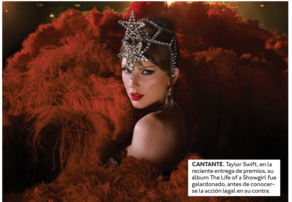
CANTANTE. Taylor Swift, en la reciente entrega de premios, su álbum The Life of a Showgirl fue galardonado, antes de conocerse la acción legal en su contra.