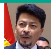
Fernando Aramayo CANCELLER DEL GOBIERNO DE BOLIVIA

“Nos hicieron sentir orgullosos, tenemos una gran selección. Vamos a ir a esperarlos, aplaudirlos. Gracias por haberlo dado todo”.