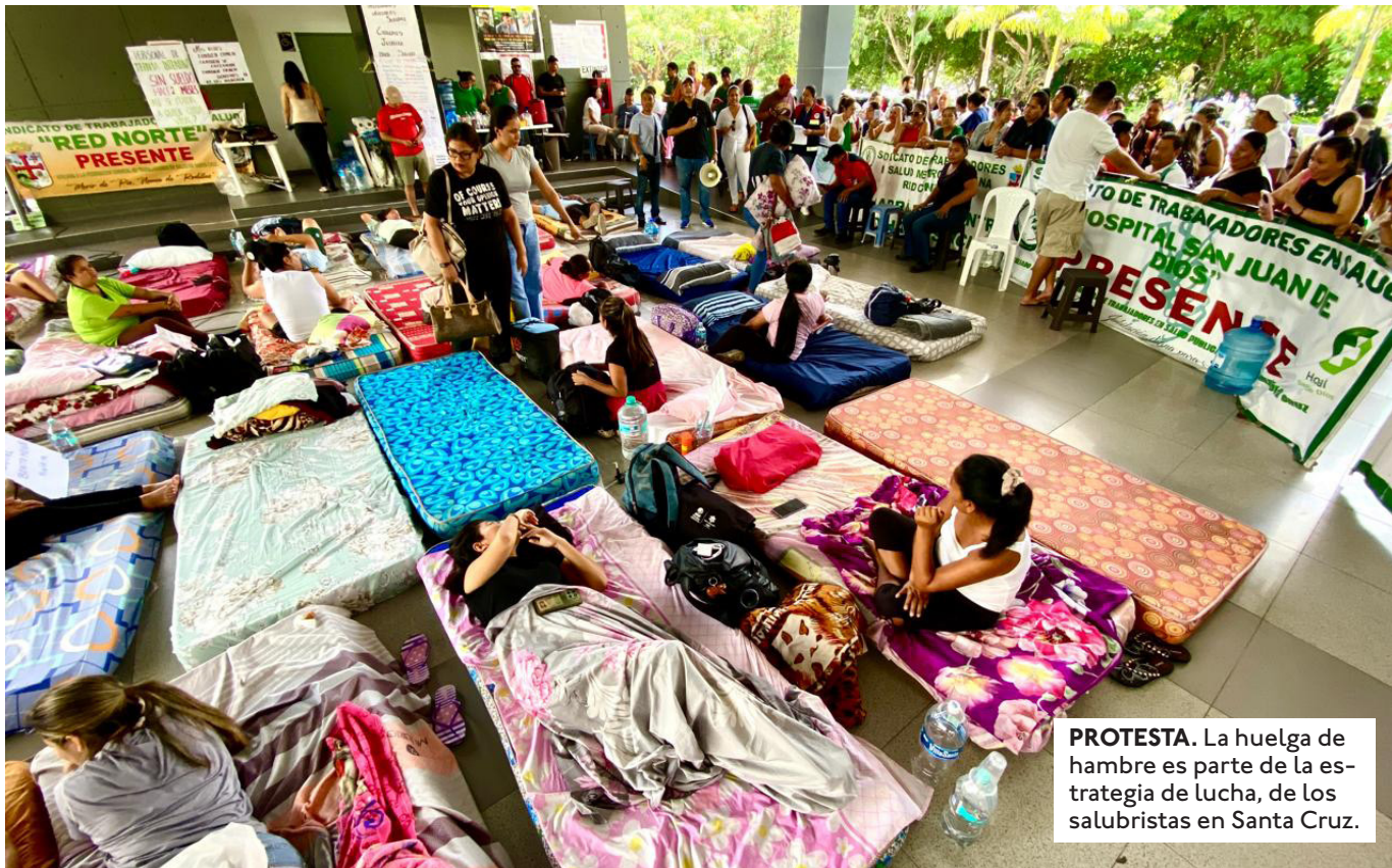
PROTESTA. La huelga de hambre es parte de la estrategia de lucha, de los salubristas en Santa Cruz.

LOS GENDARMES AMENAZAN CON NO TRABAJAR EN LA ÚLTIMA PRECARNAVALERA. EXIGEN EL PAGO DEL SUELDO DE DICIEMBRE Y LOS BONOS.