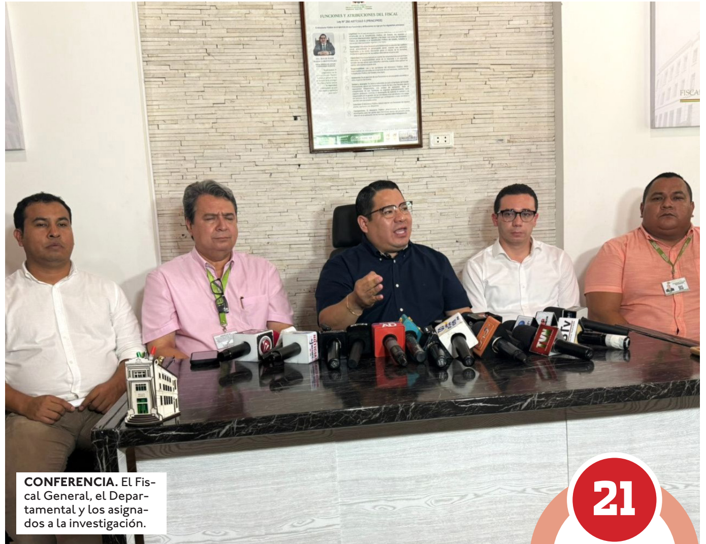
CONFERENCIA. El Fiscal General, el Departamental y los asignados a la investigación.

Sabían antes de que estalle el escándalo. El caso maletas salió a la luz la semana pasada tras informes periodísticos, pero el pre-