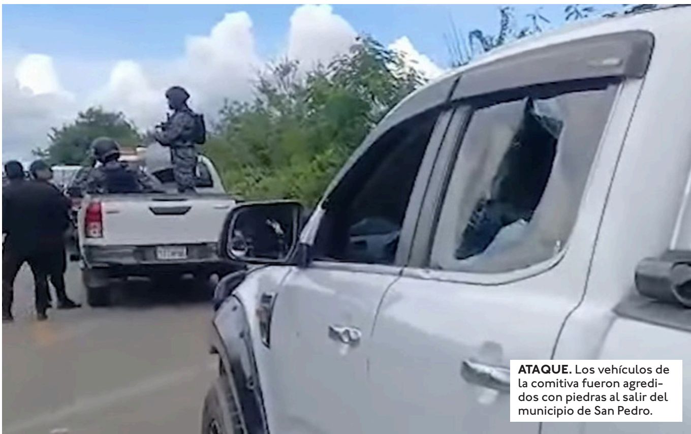
ATAQUE. Los vehículos de la comitiva fueron agredidos con piedras al salir del municipio de San Pedro.