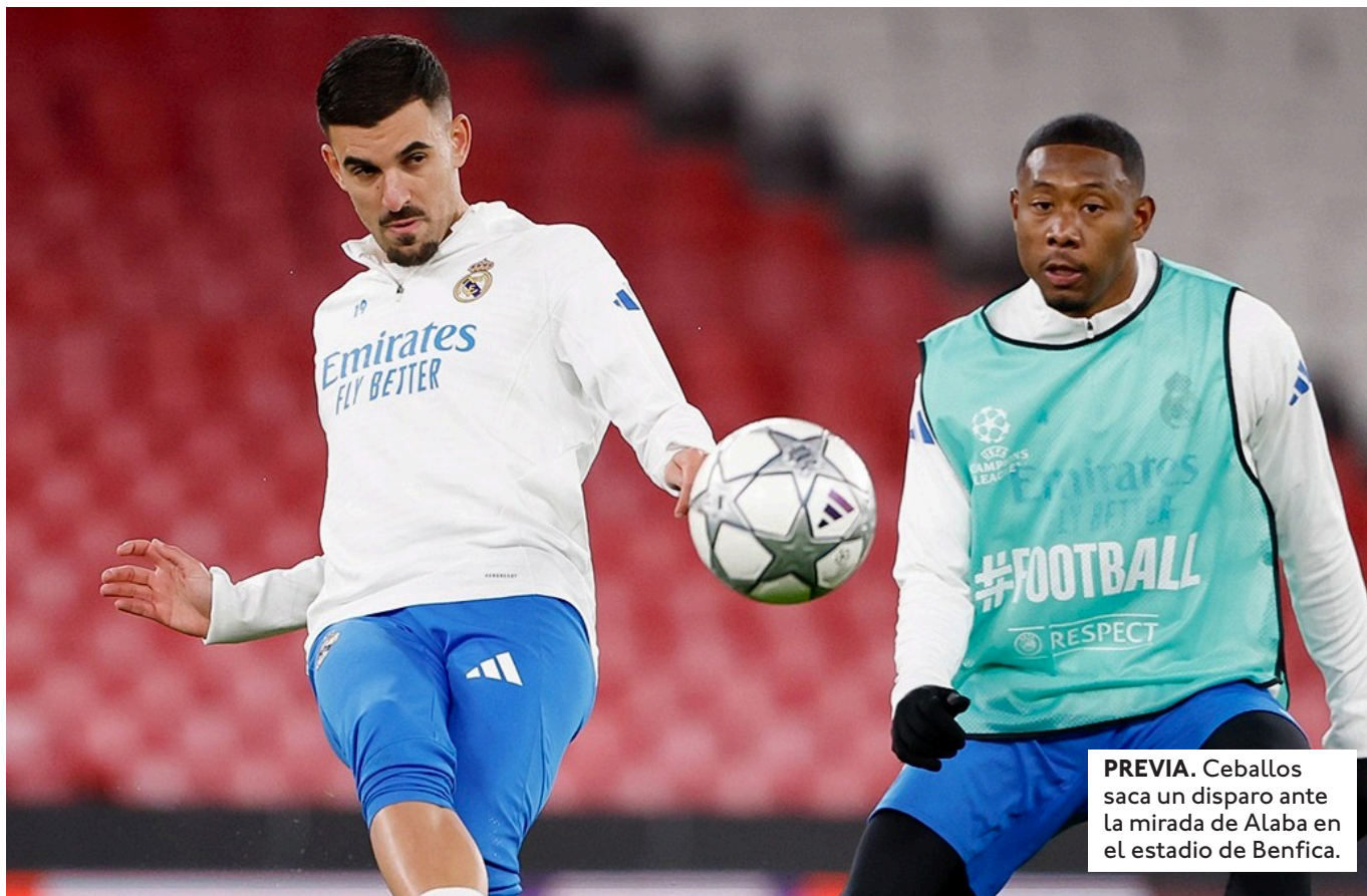
PREVIA. Ceballos saca un disparo ante la mirada de Alaba en el estadio de Benfica.

"JUGAREMOS CONTRA UN GRAN EQUIPO Y GRANDES JUGADORES. O MATAS O MUERES. INTENTAREMOS ESO MAÑANA A TRAVÉS DEL EQUILIBRIO", DIJO EL DT DE BENFICA.