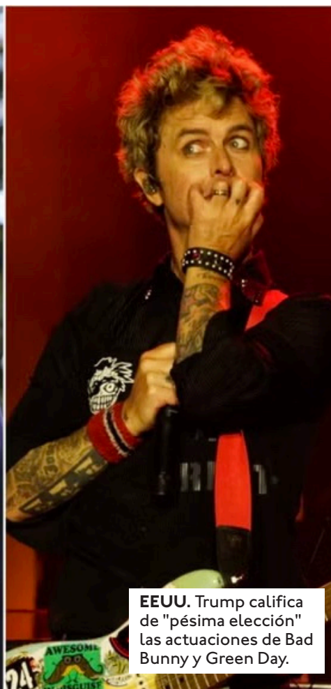
EEUU. Trump califica de "pésima elección" las actuaciones de Bad Bunny y Green Day.