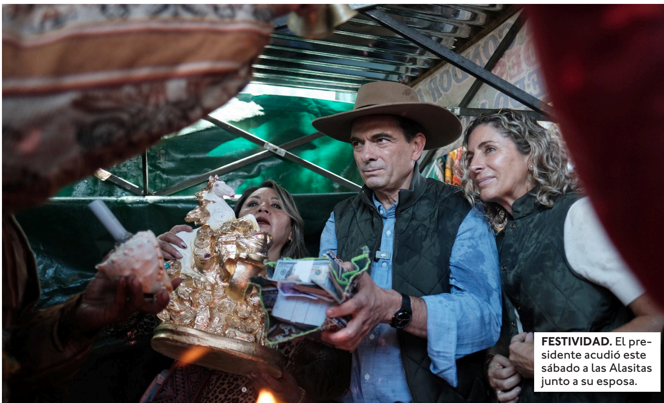
FESTIVIDAD. El presidente acudió este sábado a las Alasitas junto a su esposa.

"LO QUE QUIERO DECIRLE AL PRESIDENTE (RODRIGO PAZ) ES QUE AL EKEKO HAY QUE PEDIRLE TODO, PERO NOSOTROS SOLO LE PEDIMOS QUE EL 50/50 SEA UNA REALIDAD", DIJO EL ALCALDE DE LA PAZ.