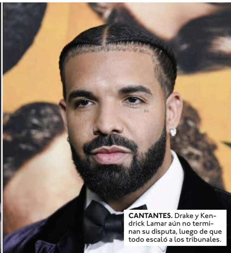
CANTANTES. Drake y Kendrick Lamar aún no terminan su disputa, luego de que todo escaló a los tribunales.