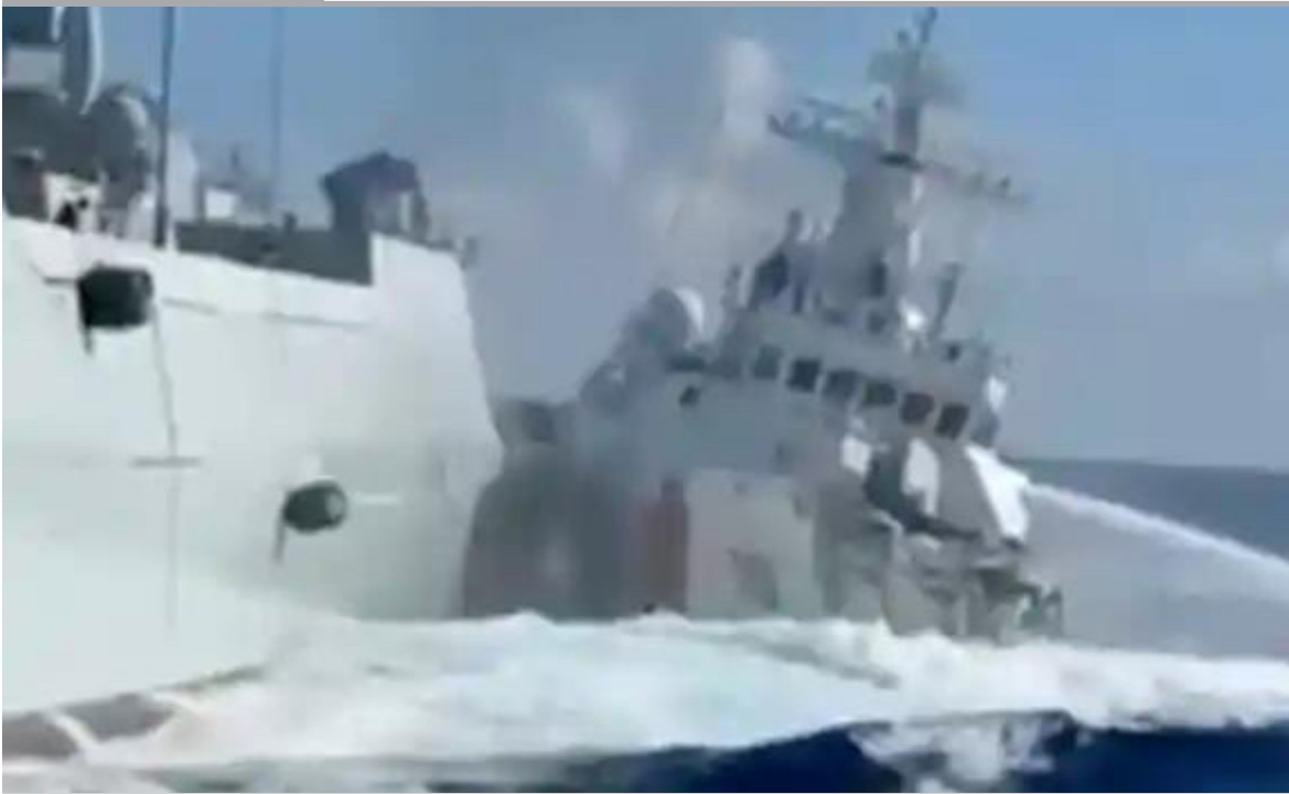
NAUFRAGIO. Equipos de la Guardia Costera china rescataron a 13 tripulantes filipinos tras el naufragio de un carguero en aguas cercanas al disputado atolón de Scarborough, en el mar de China Meridional. La embarcación se hundió a unas 55 millas náuticas del arrecife, mientras continúa la búsqueda de otros siete desaparecidos en una zona marcada por tensiones entre Pekín y Manila.

Mientras Venezuela despierta a un verano político inesperado, Cuba sigue atrapada en una larga noche que algunos ya sueñan con ver terminar antes de Navidad. La captura de Nicolás Maduro marcó un punto de quiebre regional: no solo abrió una transición democrática en Caracas, sino que dejó a La Habana sin su sostén vital. El castrismo, acostumbrado a sobrevivir de subsidios ajenos, hoy exhibe una fragilidad inédita. Recientes declaraciones filtradas por el Wall Street Journal y que hablan de una solución en Cuba antes de fin de año, reflejan algo más que intenciones: muestran un clima político en Washington convencido de que el efecto dominó es posible. Venezuela empieza a proyectar crecimiento, inversiones y recuperación económica; Cuba, en cambio, enfrenta escasez, miedo y represión como únicas respuestas del régimen. La expectativa no es ingenua ni automática. Nadie promete milagros, pero el contraste es evidente: donde cae una dictadura, asoma la esperanza. Para los venezolanos, el calor del cambio ya se siente. Para los cubanos, quizá esta vez la Navidad no sea solo una metáfora.