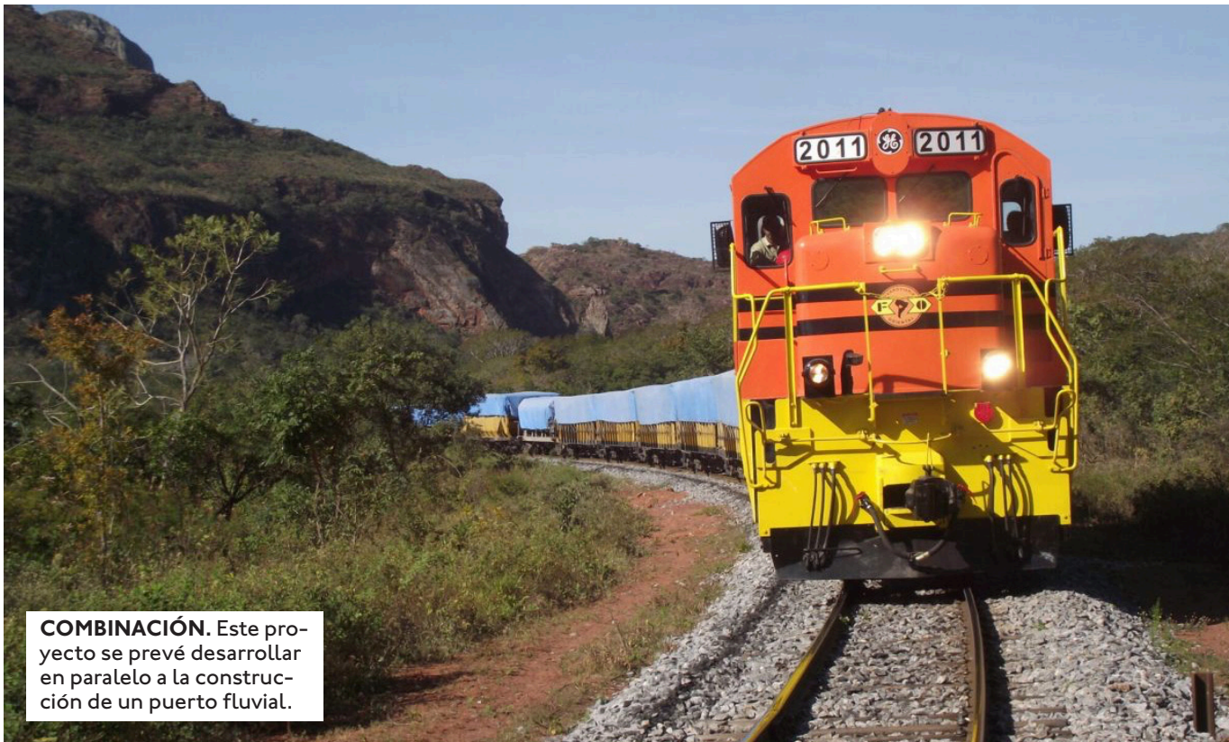
COMBINACIÓN. Este proyecto se prevé desarrollar en paralelo a la construcción de un puerto fluvial.

LA PRIMERA FASE DEL PROYECTO CONTEMPLA LA CONEXIÓN FERROVIARIA DEL ÁREA DE CONCE- SIÓN MUTÚN Y PUERTO BUSCH,