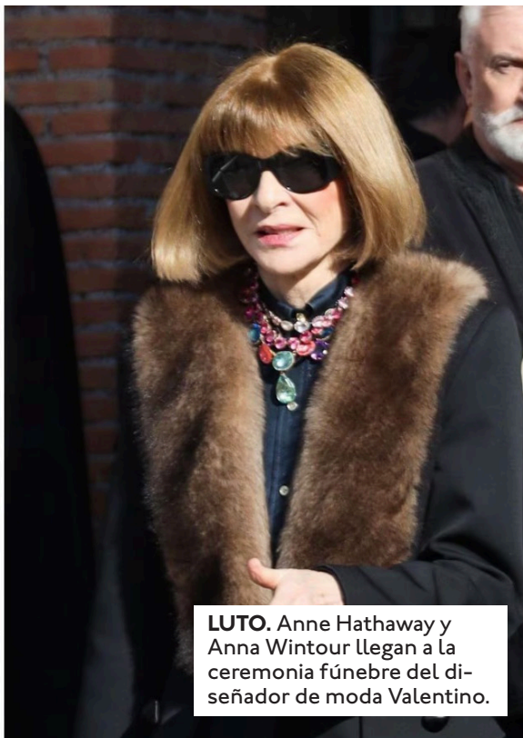
LUTO. Anne Hathaway y Anna Wintour llegan a la ceremonia fúnebre del diseñador de moda Valentino.

"titán de la moda" que también fue amigo suyo, con quien compartía momentos de baile y karaoke. "Hizo que mi mundo fuera mucho más luminoso, grandioso y maravilloso de lo que jamás hubiera podido imaginar", escribió en Instagram. La mayoría de los asistentes, incluidos empleados de la casa Valentino, vestían de negro, empezando por Giancarlo Giammetti, quien fue su pareja. Pese a ello muchos lucían también sombreros, bufandas o chales rojos, recordando el color emblemático del creador, el llamado "rojo Valen-