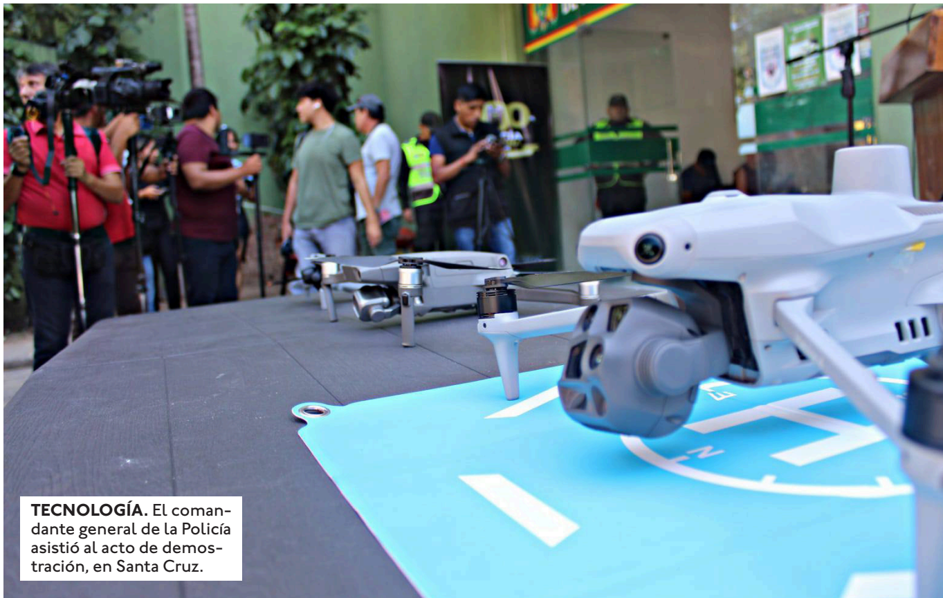
TECNOLOGÍA. El comandante general de la Policía asistió al acto de demostración, en Santa Cruz.

EL SISTEMA CUENTA CON UNA ANTENA STARLINK, QUE BRINDA INTERNET SATELITAL, ADEMÁS, DISPONE DE UNA ANTENA REPETIDORA