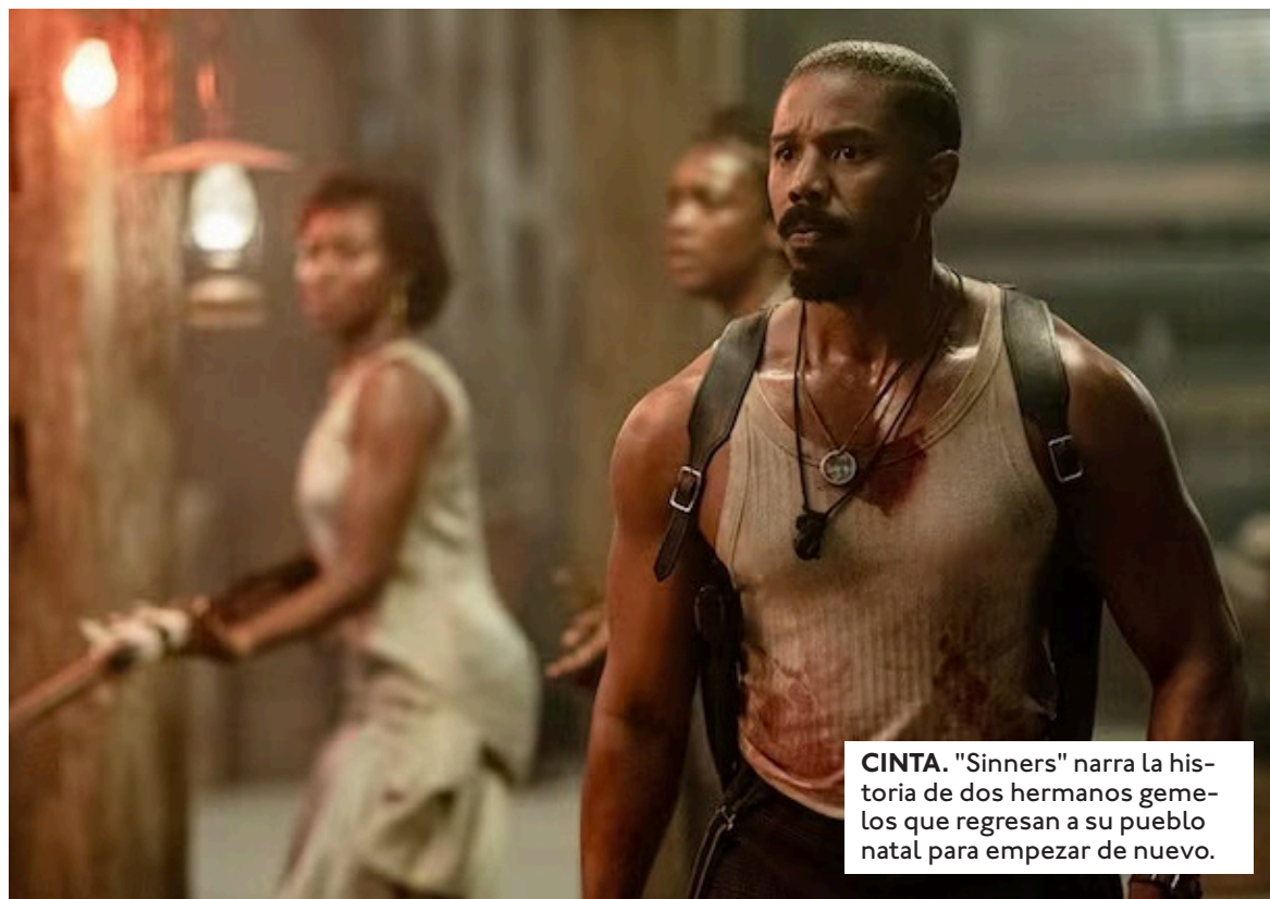
CINTA. "Sinners" narra la historia de dos hermanos gemelos que regresan a su pueblo natal para empezar de nuevo.

El impacto de este logro se mide frente a referentes históricos: con sus 16 menciones, la película de Coogler deja atrás a "All About Eve" (1950), "Titanic" (1997) y "La La Land" (2016), todas con 14. En cuanto a triunfos, el récord vigente de 11 estatuillas lo comparten "Ben-Hur" (1959), "Titanic" y "El Señor de los Anillos: El Retorno del Rey" (2003). Más allá de las cifras, Ryan Coogler se transforma en el segundo cineasta negro en ser nominado, en el mismo año, como produc-