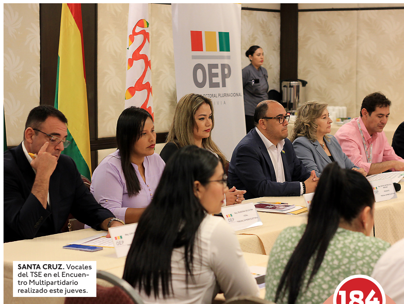
SANTA CRUZ. Vocales del TSE en el Encuentro Multipartidario realizado este jueves.

dar acceso a los frentes a todas las fases de conformación del Padrón Electoral, pero respetando el trabajo técnico que realiza el Servicio de Registro Cívico (Sereci). El TSE y los tribunales departamentales entregarán la información estadística del Padrón a las organizaciones políticas.