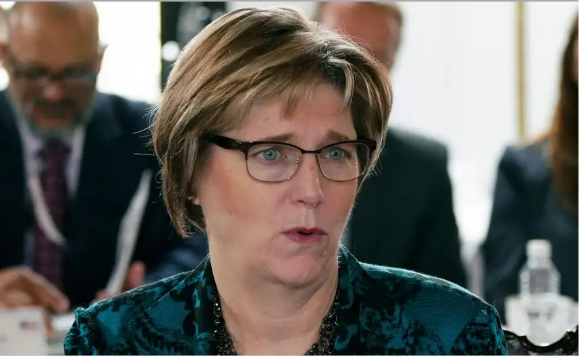
VENEZUELA. Washington dio un nuevo paso en su reconfiguración de la política hacia Venezuela al nombrar a la diplomática Laura Dogu como jefa de misión de la Unidad de Asuntos para ese país, con sede en Colombia. La designación se produce en medio del acercamiento entre la Administración Trump y el gobierno venezolano tras la salida de Nicolás Maduro.

Los avasallamientos han marcado al MAS como punta de lanza de males estructurales: narcotráfico, tráfico de tierras, incendios forestales y ataques sistemáticos al oriente boliviano. Que un cacique chiquitano de 70 años haya sido agredido refleja la gravedad del problema y la impunidad que persiste. La demora en la depuración del INRA es inadmisibile. Cambiar a funcionarios no es suficiente si no se redefine la institucionalidad del organismo, eliminando todo vestigio de la anterior gestión que protegía a avasalladores. Los cívicos provinciales, la Cidob y la Nación Chiquitana han exigido medidas inmediatas: captura de agresores, auditoría de títulos y reemplazo total de autoridades en Santa Cruz. Mientras se conforman ministerios y se hacen nombramientos anodinos, se descuida la prioridad central: garantizar seguridad jurídica y proteger la propiedad privada. El gobierno debe actuar con decisión y rapidez. Cada día de demora fortalece a mafias que saquean tierras y destruyen el aparato productivo. La institucionalidad del INRA no puede esperar; la impunidad no es una opción.