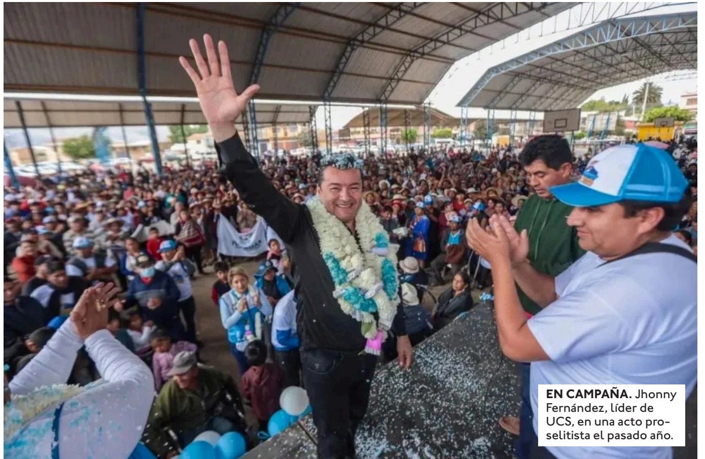
EN CAMPAÑA. Jhonny Fernández, líder de UCS, en un acto pro-selitista el pasado año.

LA PASADA SEMANA EL TSE Y EL ÓRGANO JUDICIAL ACORDARON GARANTIZAR LAS ELECCIONES EVITANDO FALLOS O RECURSOS QUE ATENTEN CONTRA SU REALIZACIÓN.