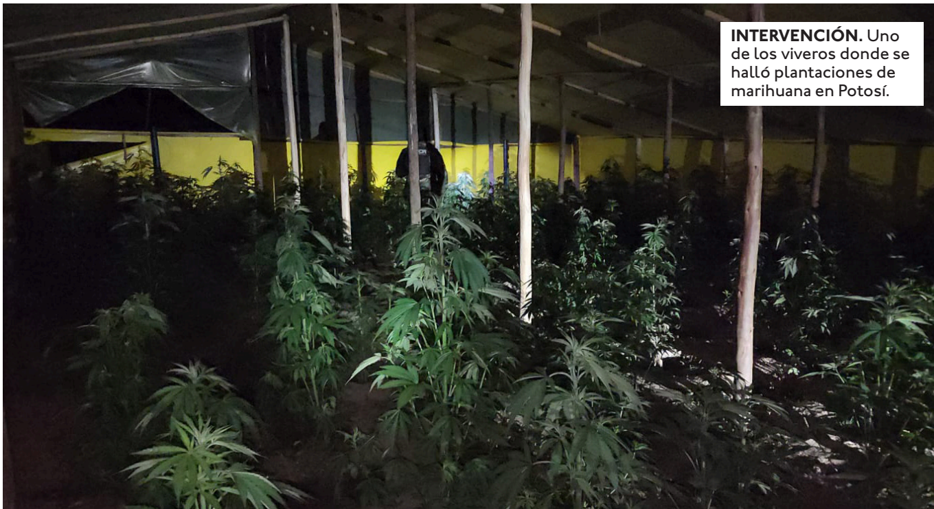
INTERVENCIÓN. Uno de los viveros donde se halló plantaciones de marihuana en Potosí.

DURANTE EL OPERATIVO, LA SITUACIÓN SE TORNÓ TENSA CUANDO ALGUNOS COMUNARIOS DETONARON DINAMITA, LO QUE OBLIGÓ AL REPLIEGUE DE LOS UNIFORMADOS.