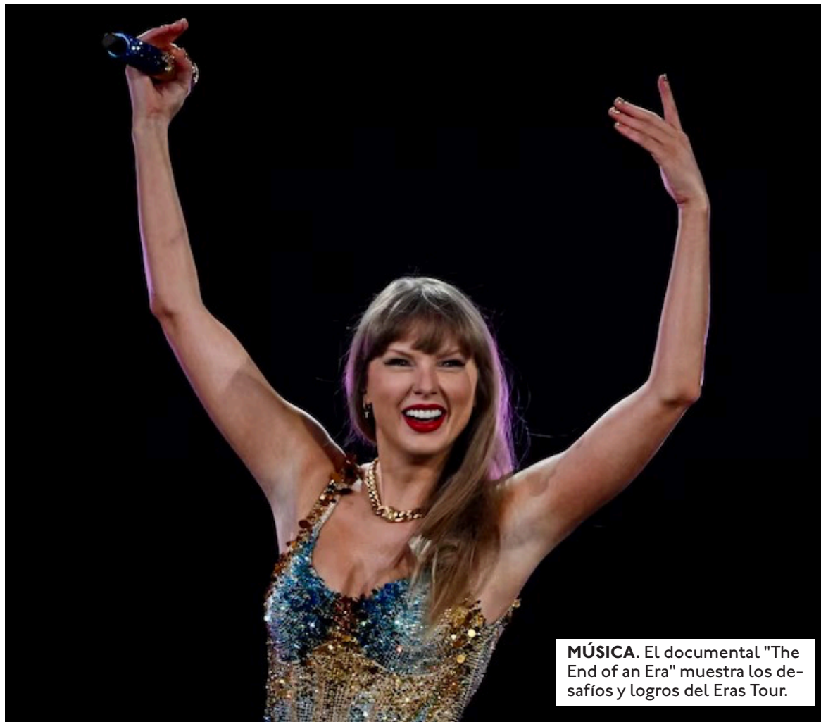
MÚSICA. El documental "The End of an Era" muestra los desafíos y logros del Eras Tour.

El detrás de escena del "Eras Tour". Mientras recibía este tipo de reconocimientos, el Eras Tour multiplicó la atención sobre su obra en todo el mundo. La serie documental The End of