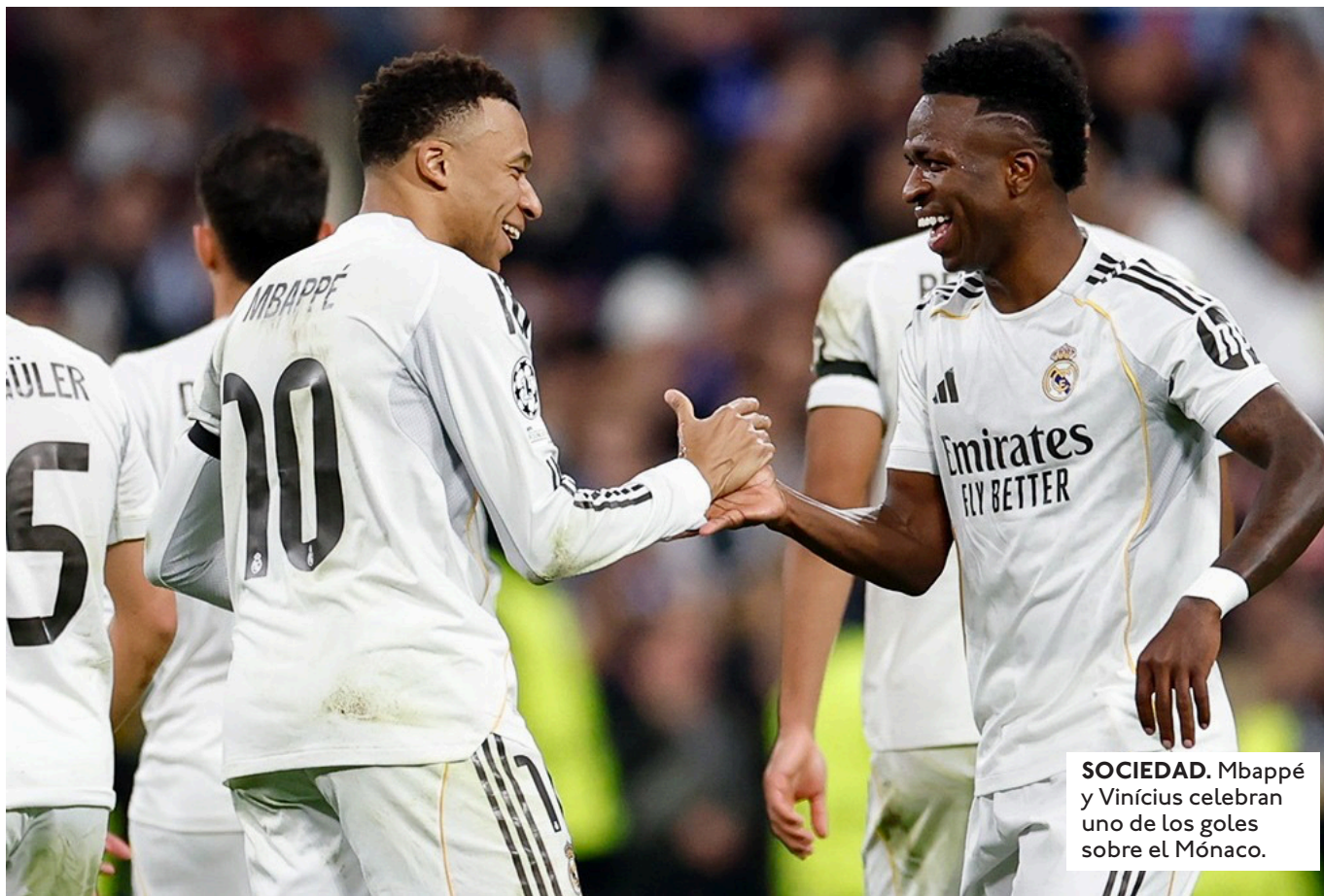
SOCIEDAD. Mbappé y Vinícius celebran uno de los goles sobre el Mónaco.

EL PSG TROPEZÓ EN PORTUGAL TRAS CAER 2-1 ANTE EL SPORTING, TOTTENHAM SUPERÓ 2-0 AL DORTMUND, BRUJAS GOLEÓ 4-1 AL KAIRAT Y VILLARREAL 1-2 AJAX.