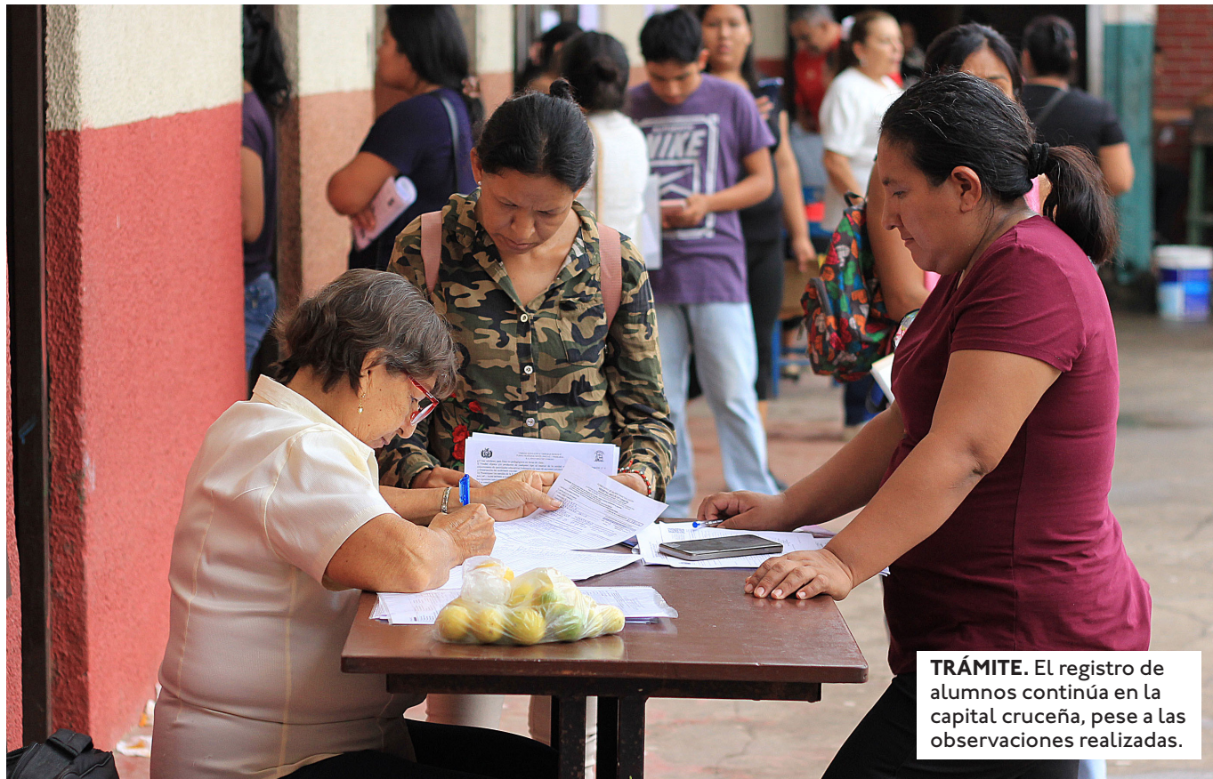
TRÁMITE. El registro de alumnos continúa en la capital cruceña, pese a las observaciones realizadas.

EL MINISTERIO DE EDUCACIÓN HABILITÓ LOS NÚMEROS DE WHATSAPP 71550970 Y 71530671 PARA RECIBIR DENUNCIAS DIRECTAS.