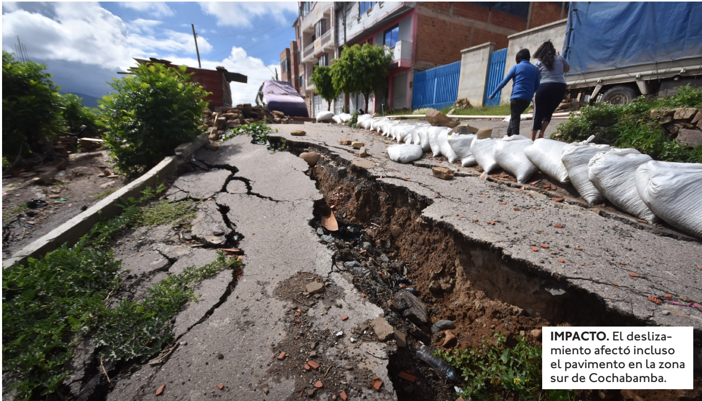
IMPACTO. El deslizamiento afectó incluso el pavimento en la zona sur de Cochabamba.

EL PAÍS SOPORTA UNA TEMPORADA LLUVIOSA DE MAYOR IMPACTO QUE OTROS AÑOS. ANTERIORMENTE HUBO GRAVES DAÑOS Y MUERTES EN ACHIRA Y EL TORNO.