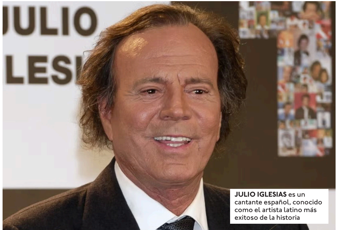
JULIO IGLESIAS es un cantante español, conocido como el artista latino más exitoso de la historia

Las mujeres describen un ambiente marcado por el control, el acoso y el abuso de poder, así como por comportamientos que califican de agresiones sexuales, tocamientos no consentidos e insultos continuados. Los hechos, según relatan, se produjeron cuando Julio Iglesias tenía 77 años. La investigación periodística, desarrollada durante tres años, incluye entrevistas repetidas con las afectadas, testimonios adicionales de extrabajadores y abundante documentación que respalda los relatos. Una de las denunciantes, identificada con un nombre ficticio para proteger su identidad, afirma que fue presionada para mantener encuentros sexuales con el cantante. Según su testimonio, era llamada con frecuencia a su habitación tras finalizar la jornada laboral, donde describe penetraciones no consentidas, bofetadas y vejaciones físicas y verbales. "Me sentía como un objeto", relata. Estos episodios se producían, según su versión, casi siempre con la presencia y participación de otra