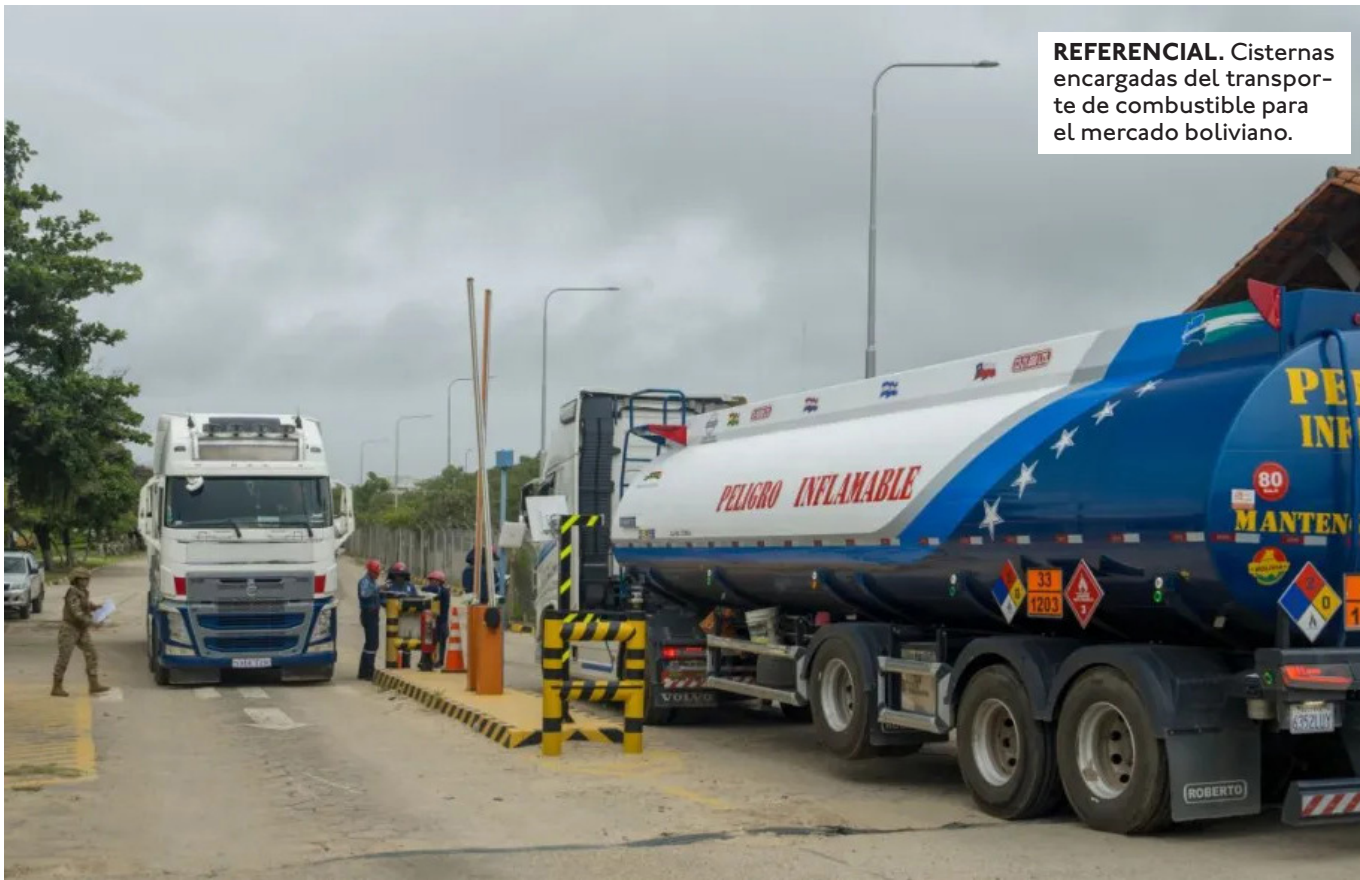
REFERENCIAL. Cisternas encargadas del transporte de combustible para el mercado boliviano.

LA ANH INTERVINO UN INMUEBLE EN LA PAZ DONDE SE ACOPIABA DIÉSEL. SE INCAUTÓ TRES CAMIONES CON 14 MIL LITROS Y SE APREHENDIÓ A TRES PERSONAS.