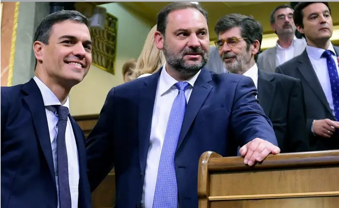
ESPAÑA. El exministro de Transportes español José Luis Ábalos, cercano al presidente Pedro Sánchez, será juzgado por corrupción junto a un colaborador y un empresario. En prisión preventiva, Ábalos enfrenta múltiples cargos, entre ellos malversación, cohecho y tráfico de influencias, relacionados con contratos irregulares de mascarillas durante la pandemia. La causa afecta también a otros ex altos cargos del PSOE.

Hay decisiones que requieren tiempo, procesos y auditorías serias. Nadie pide improvisar cuando se trata de inversiones, contratos o infraestructura pública. Pero hay otras situaciones que no admiten dilación, porque la respuesta es evidente desde el origen. El caso de Emapa pertenece a esta segunda categoría. Esta empresa fue creada para impulsar la producción, pero nunca pudo ser útil, sostenible ni beneficiosa para el productor. Ni nunca lo será. Su diseño responde a un modelo estatista que ya demostró su fracaso: distorsiona el mercado, compite de forma desleal, incrementa la burocracia y abre puertas gigantes a la corrupción. No hay nada que analizar respecto a su continuidad. Una empresa concebida para intervenir el mercado termina, inevitablemente, desviando recursos, subsidiando ineficiencias y castigando al pequeño productor al que dice proteger. Si el Gobierno realmente quiere fomentar la producción y ayudar al campesino, lo primero que debe hacer es quitarse del medio. En la tardanza está el peligro: que los nuevos gobernantes se encariñen con el viejo modelo del MAS, que no deja de ser ventajoso... para los burócratas, por supuesto.