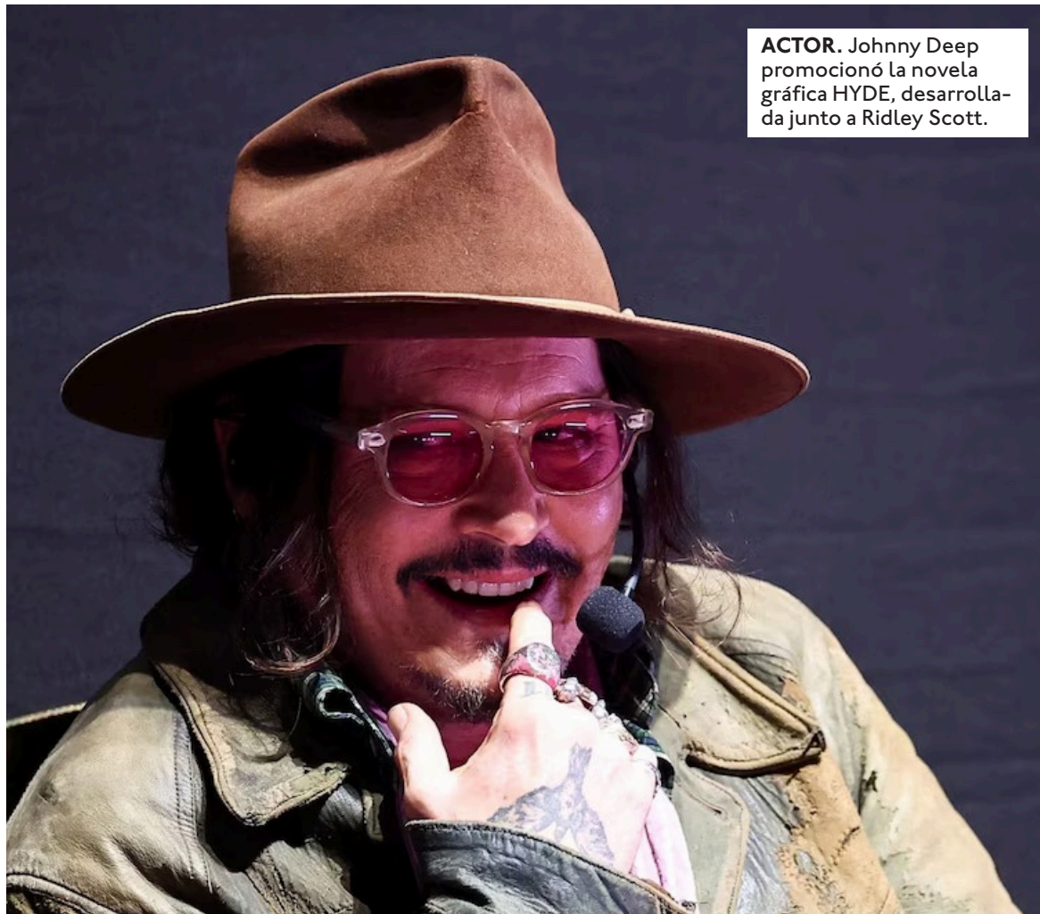
ACTOR. Johnny Depp promocionó la novela gráfica HYDE, desarrollada junto a Ridley Scott.

Un regreso marcado por homenajes y nuevos proyectos. Durante su panel, los organizadores le entregaron a Depp una pieza artística personalizada que reproducía a su personaje Capitán Jack Sparrow al estilo del anime One Piece. La ilustración fue realizada