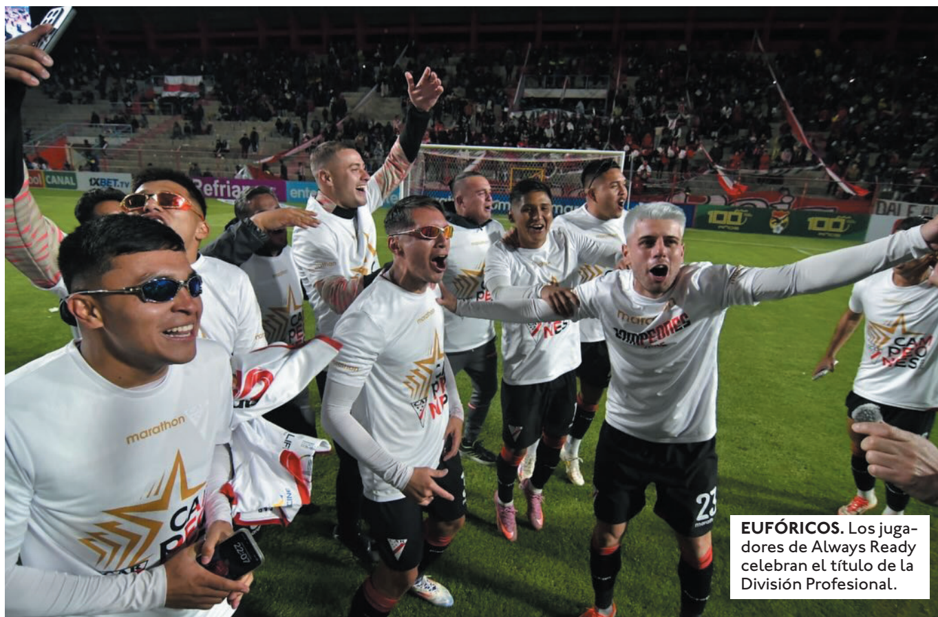
EUFÓRICOS. Los jugadores de Always Ready celebran el título de la División Profesional.

LOGRÓ VENCER A REAL ORU- RO (1-2) EN CONDICIÓN DE VISITANTE Y SE JUGARÁ LA CLASIFICA- CIÓN A TOR- NEO INTER- NACIONAL EL DOMINGO ANTE TOMA- YAPO.