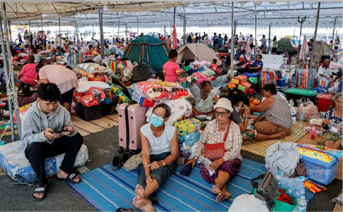
EVACUADOS. Más de 500.000 personas fueron evacuadas de la frontera entre Tailandia y Camboya tras cuatro días de enfrentamientos que dejaron al menos 11 muertos. La mayoría de los desplazados están en territorio tailandés, donde más de 400.000 civiles fueron llevados a refugios ante el incremento de los ataques, mientras ambos países se acusan de reactivar las hostilidades.

Al igual que el presidente Rodrigo Paz, todos hablan mal de los intermediarios a la hora de referirse al precio de la carne, pero aunque parezca paradójico, el remedio no es eliminarlos, sino multiplicarlos. Es peligroso cuando un político habla de precios. El riesgo es que decida meter mano y ya conocemos las graves consecuencias de aplicar controles. Si el primer mandatario considera una plaga a los comerciantes responsables de elevar el precio de la carne, lo correcto es ver la enfermedad y no el síntoma, pues el verdadero problema en el mercado de la carne no es la existencia de intermediarios, sino su escasez. Cuando pocos controlan el flujo entre productor y consumidor, el resultado es un monopolio disfrazado. Y para combatirlo se necesita —como dice el refrán— un cuchillo de la misma casa: más competencia, más actores, más intermediarios. Eliminarlos solo concentra poder. Promover la competencia lo distribuye. Con más oferentes disputando al cliente, los márgenes se reducen y el precio cae por su propio peso. La tarea del gobierno ahora es ver dónde están las trancas para que haya más... intermediarios.