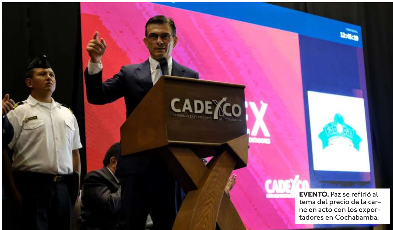
EVENTO. Paz se refirió al tema del precio de la carne en acto con los exportadores en Cochabamba.

FEGASACRUZ HIZO LA PROPUESTA AL GOBIERNO LA SEMANA PASADA. ESTARÍA INTEGRADO POR EL SECTOR PRIVADO, PÚBLICO E INDUSTRIA PARA TENER DATOS DE LA OFERTA Y EXCEDENTES DE CARNE.