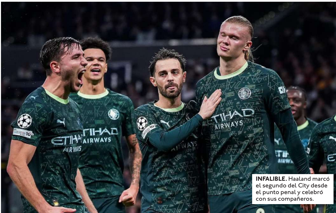
INFALIBLE. Haaland marcó el segundo del City desde el punto penal y celebró con sus compañeros.

EL DUELO ENTRE EL CONJUNTO ESPAÑOL Y FRANCÉS QUEDÓ IGUALADO 0-0. EL LEVERKUSEN Y EL NEWCASTLE TAMBIÉN REPARTIERON PUNTOS TRAS EL 2-2.