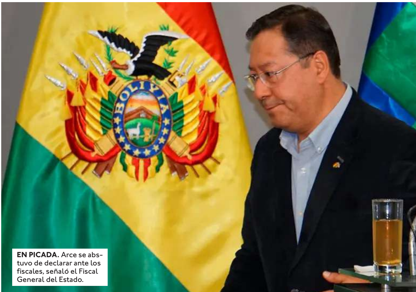
EN PICADA. Arce se abstuvo de declarar ante los fiscales, señaló el Fiscal General del Estado.

EL 9 DE DICIEMBRE LA NUEVA DIRECTIVA DEL FONDO INDÍGENA AMPLIÓ LA DENUNCIA EN EL CASO LIDIA PATTY PARA QUE ARCE ARCE SEA INCLUIDO, REVELÓ EL FISCAL GENERAL, ROGER MARIACA.