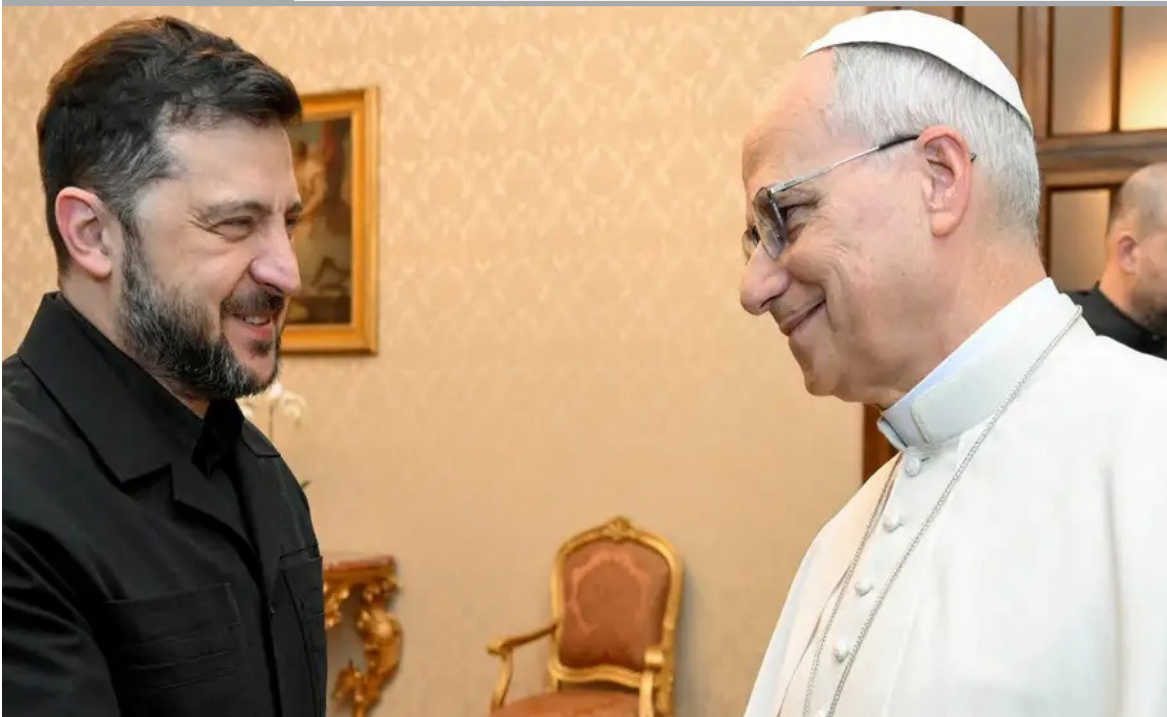
VISITA. El papa León XIV recibió este martes en Castel Gandolfo al presidente ucraniano, Volodimir Zelenski, y reiteró la urgencia de impulsar el diálogo para alcanzar una “paz justa y duradera” en la guerra con Rusia. Durante la reunión, el pontífice también abordó la situación de los prisioneros y el retorno de niños ucranianos a sus familias.

Millones de latinos han cruzado fronteras huyendo de gobiernos izquierdistas que prometían justicia social y terminaron ahogándolos en inflación, escasez y desempleo. Han llegado a Estados Unidos buscando lo obvio: libertad, empleo, educación y un futuro para sus hijos. Lo han encontrado. Sin embargo, aquí viene la paradoja: mientras Estados Unidos vive un momento electoral crítico, con elecciones presidenciales y congresales cada vez más polarizadas, buena parte del voto latino tiende a inclinarse hacia la izquierda, tal como se ha demostrado recientemente en Nueva York. No se trata de un capricho: es un curioso guiño a la nostalgia ideológica, a la idea romántica de un Estado que cuide, redistribuya y garantice derechos. Mientras escapaban de esa misma retórica, ahora parecen fascinados por su versión estadounidense. Quizá es generacional: los jóvenes valoran el progresismo, la diversidad y los programas sociales; los mayores, en cambio, recuerdan las colas del pasado. O tal vez sea simplemente la ironía de la historia: quienes huyeron del socialismo por su colapso, ahora lo buscan en un país que les ha dado todo lo que aquel nunca pudo. En un Estados Unidos donde los latinos son el grupo que más rápido crece, su voto será decisivo, y la paradoja está servida.