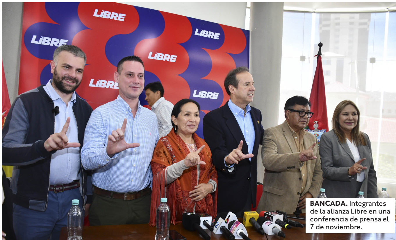
BANCADA. Integrantes de la alianza Libre en una conferencia de prensa el 7 de noviembre.

ESTÁN EN TRATAMIENTO EN LA ALP TRES CRÉDITOS EXTERNOS POR $US 680 MILLONES. EDMAND LARA HA PEDIDO QUE SE JUSTIFIQUE EL GASTO PARA APROBARLOS.