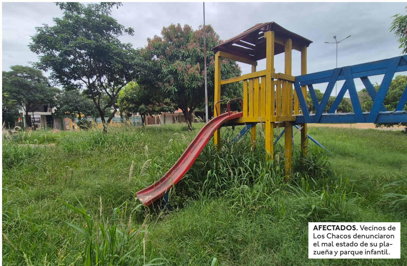
AFECTADOS. Vecinos de Los Chacos denunciaron el mal estado de su plazuela y parque infantil.

TRAS EL CIERRE DEL AÑO ESCOLAR PRÁCTICAMENTE TODOS LOS DÍAS SE REALIZAN ACTOS DE GRADUACIÓN DE KINDER Y DEL NIVEL SECUNDARIO.