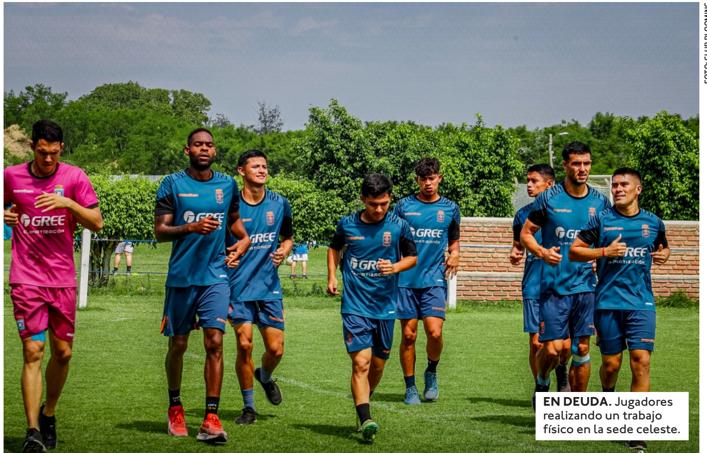
EN DEUDA. Jugadores realizando un trabajo físico en la sede celeste.

VISITARÁ ESTE MIÉRCOLES A UN VINTO (17:30) FUERA DE CARRERA. EL CUADRO DE SUCRE TIENE 39 PUNTOS Y ESTÁ OBLIGADO A GANAR PARA SEGUIR ASPIRANDO A UN PREMIO.