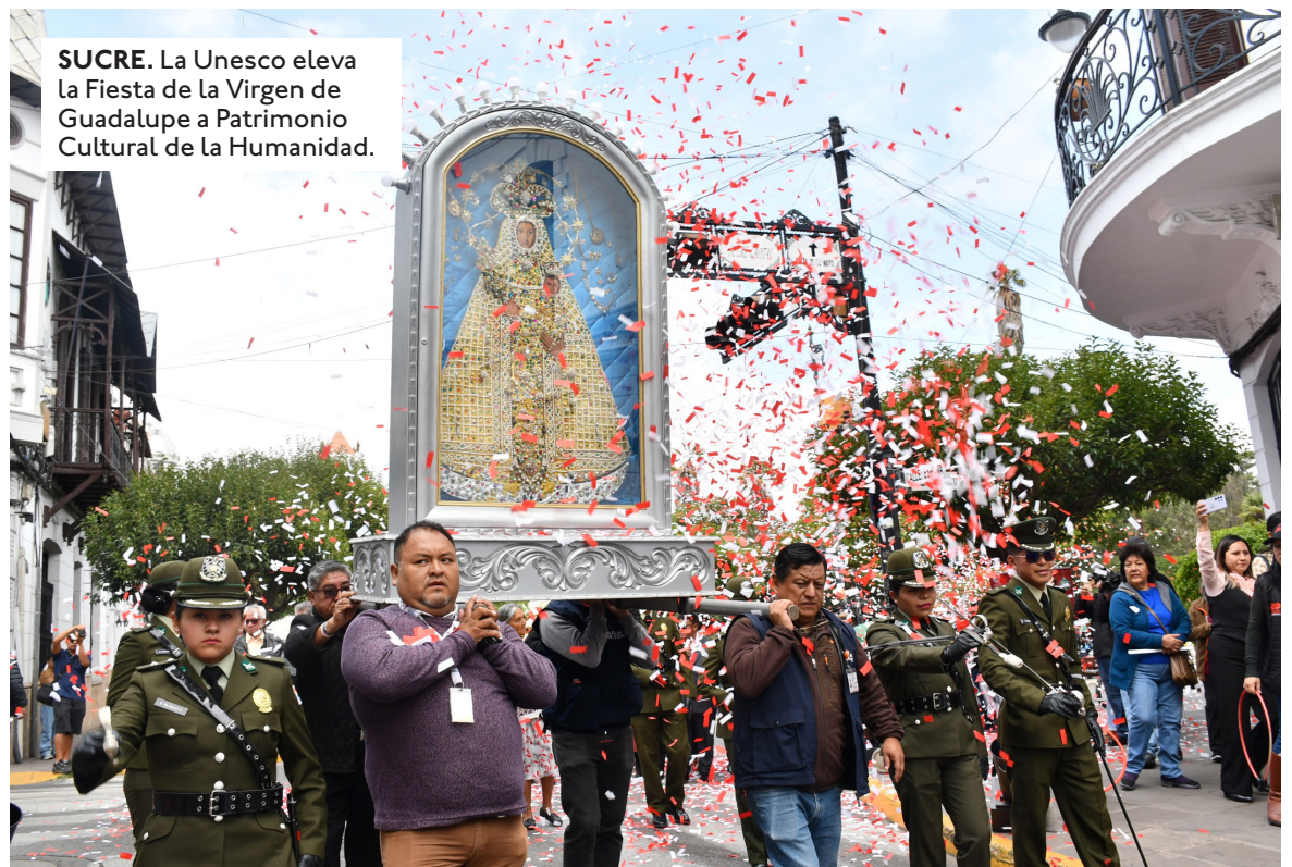
SUCRE. La Unesco eleva la Fiesta de la Virgen de Guadalupe a Patrimonio Cultural de la Humanidad.

"El acompañamiento de la Virgen de Guadalupe ha estado presente en la historia de Sucre, Chuquisaca y de todo Bolivia. Es la primera representación religiosa del país y una de las más antiguas del continente", expresó durante la misa el arzobispo Ricardo Centellas. Desde el gobierno, el Ministerio de Turismo Sostenible, Culturas, Folclore y Gastronomía destacó que el nombramiento otorgado por la