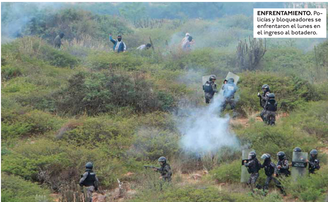
ENFRENTAMIENTO. Policías y bloqueadores se enfrentaron el lunes en el ingreso al botadero.

ASÍ LO REVELARON MEDIOS TELEVISIVOS EN BASE A TESTIMONIOS DE LUGAREÑOS. UN FALLECIDO ERA UN PROFESOR QUE VOLVÍA DE DEJAR NOTAS EN SU COLEGIO.