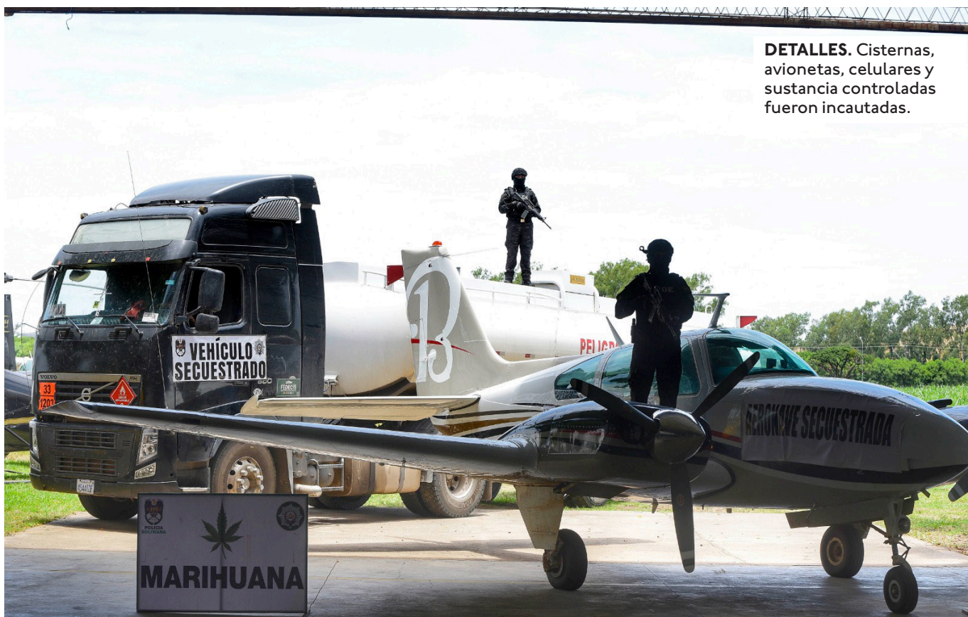
DETALLES. Cisternas, avionetas, celulares y sustancia controladas fueron incautadas.

LA FUERZA ESPECIAL DE LUCHA CONTRA EL NARCOTRÁFICO (FELCN) SE- CUESTRO 2.125 PAQUETES DE MARIHUANA CON UN PESO DE 2.361.780 GRAMOS, CON UNA AFECTACIÓN AL NARCOTRÁFICO DE 1.904.424 DÓLARES.