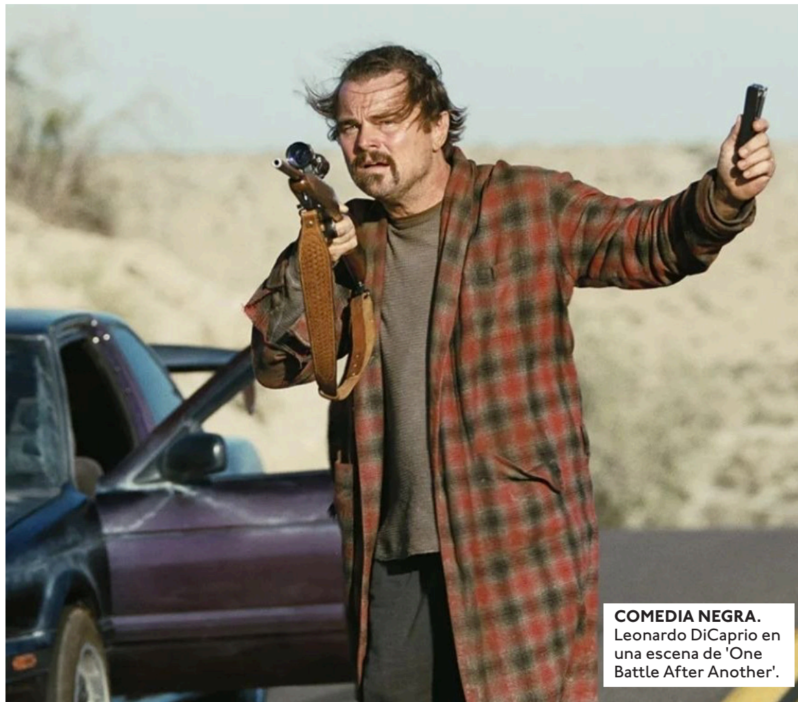
COMEDIA NEGRA. Leonardo DiCaprio en una escena de 'One Battle After Another'.

Por su trabajo en 'One Battle After Another', el actor puertorriqueño Benicio del Toro luchará por el galardón a Mejor Actor de Reparto -entre otros con su compañero de filme, Sean Penn- y DiCaprio por el de protagonista, quien disputará la estatuilla junto a Ethan