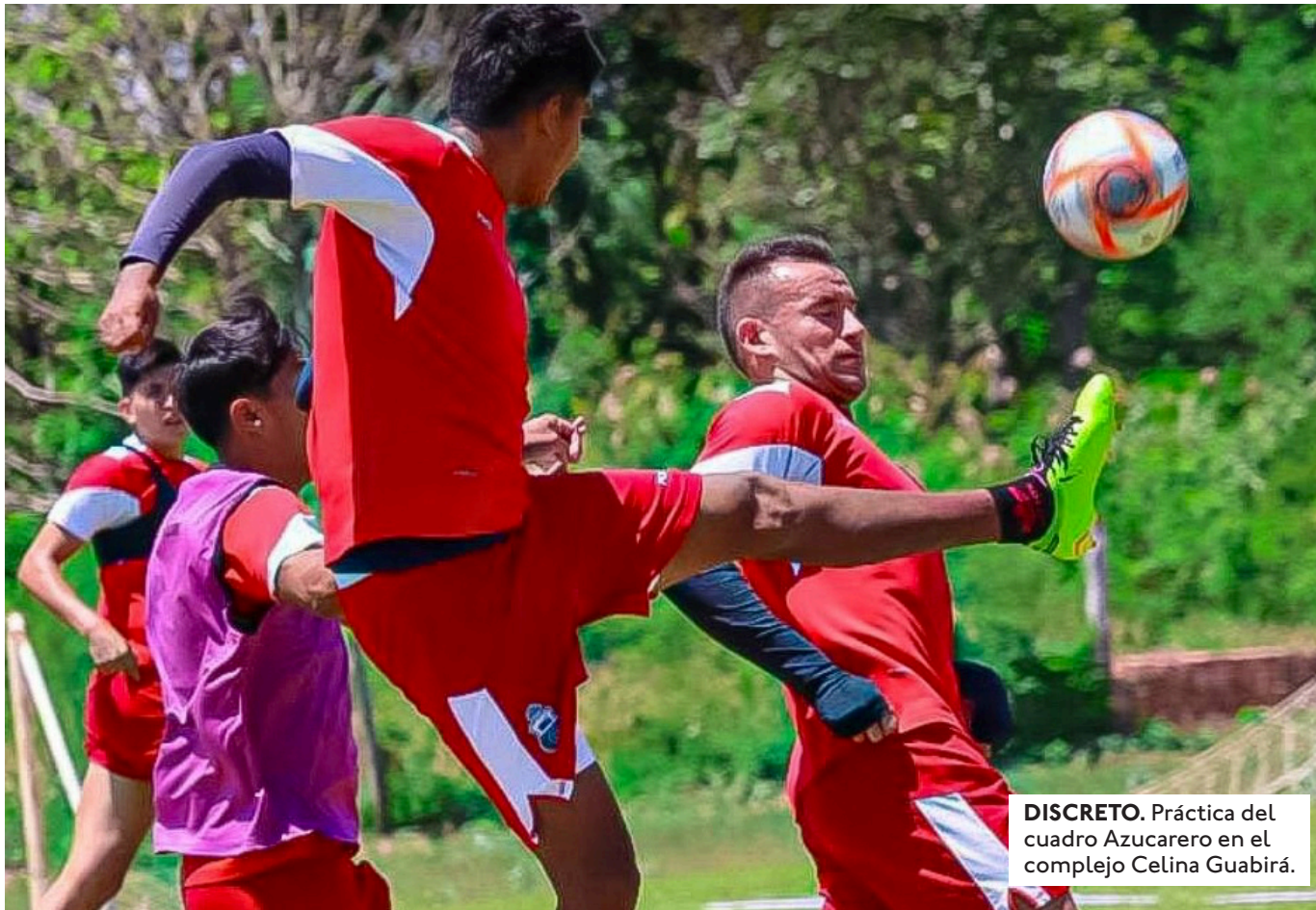
DISCRETO. Práctica del cuadro Azucarero en el complejo Celina Guabirá.

EL AVIADOR DEBE GANAR ESTE MARTES A GV (19:00) Y ESPERAR A QUE ABB PIERDA EL JUEVES ANTE ORIENTE PARA DEFINIR EL INDIRECTO EN LA ÚLTIMA FECHA.