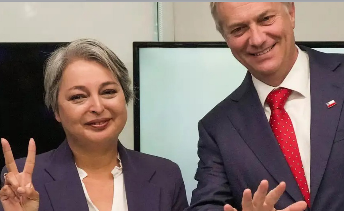
CHILE. A pocos días del balotaje presidencial en Chile, el derechista José Kast mantiene ventaja sobre la comunista Jeannette Jara, según sondeos internos y expertos. Sin embargo, errores recientes de Kast y un mal desempeño en el debate del 3 de diciembre podrían abrir una pequeña ventana para sorpresas, manteniendo la tensión en una contienda que parecía definida.

Rodrigo Paz atraviesa uno de esos momentos decisivos que definen a un presidente. Nadie puede negar que, hasta ahora, lo está haciendo bien: mantiene una aprobación sólida, ha logrado neutralizar la campaña de desprestigio promovida desde la propia Vicepresidencia y muestra una conexión natural con la gente. El problema es que ese no es el rol que la historia le exige. Según los economistas, Bolivia ya no puede seguir postergando las decisiones duras: ajustar las cuentas, sincerar precios, desmontar subsidios inviables y cortar la grasa del aparato estatal. Son medidas impopulares, sí, pero inevitables. El presidente debe asumir, cuanto antes, el papel del “malo” que corrige como un padre responsable o un médico que cura aun sabiendo que dolerá. Las colas por combustible son la señal más clara de que el tiempo se agota. Y cuando el país entra en ese terreno, surge la confusión sobre quién es bueno y quién es malo. Por eso, Paz debe actuar ahora. En esta etapa, no se trata de caer bien: se trata de hacer lo correcto. Ser malo, para ser bueno.