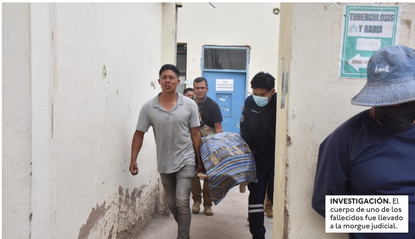
INVESTIGACIÓN. El cuerpo de uno de los fallecidos fue llevado a la morgue judicial.