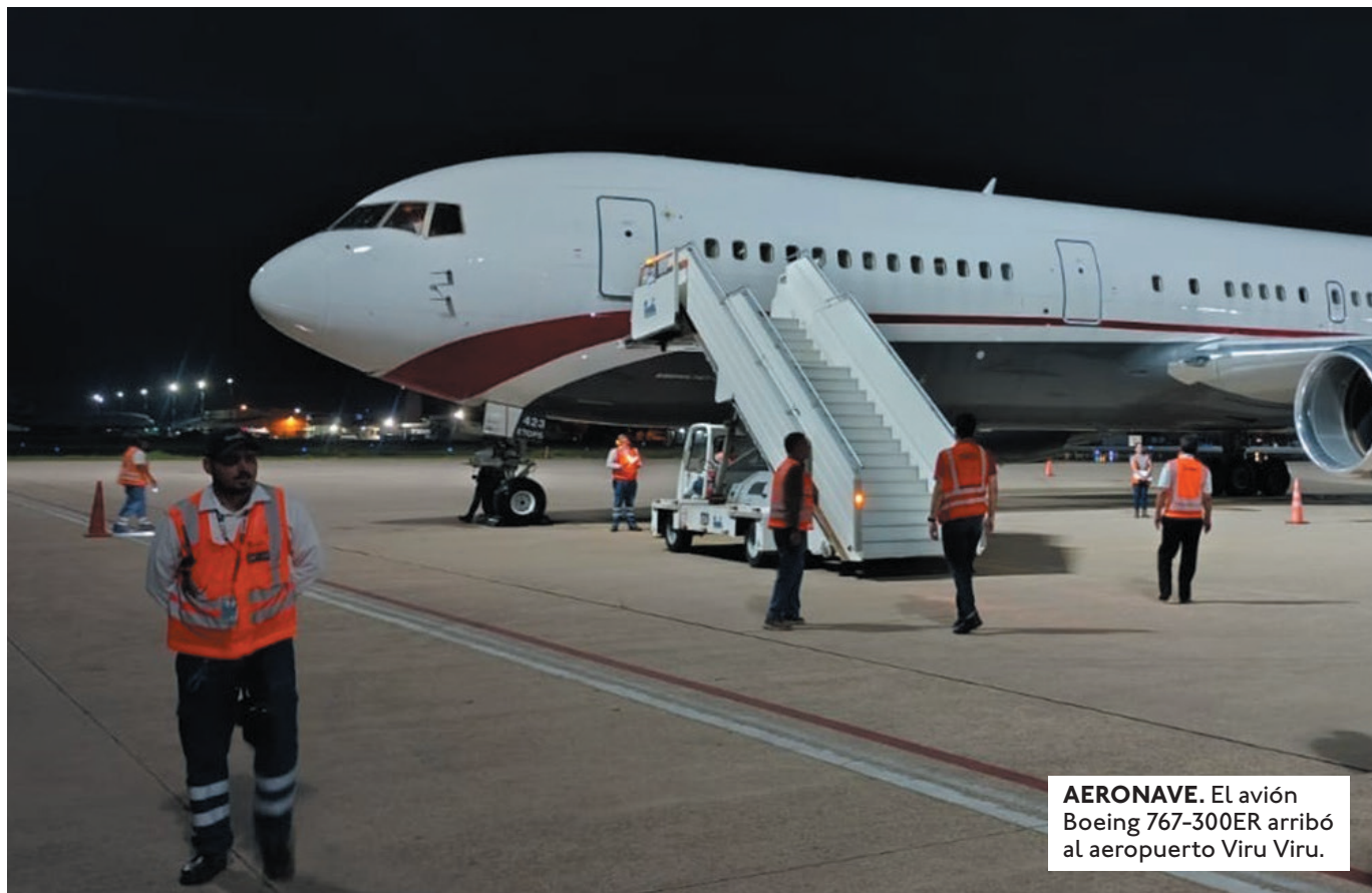
AERONAVE. El avión Boeing 767-300ER arribó al aeropuerto Viru Viru.

EN NOVIEMBRE, BOA LLEGÓ A OPERAR CON SOLO OCHO AERONAVES DE UNA FLOTA DE 20, LO QUE PROVOCÓ RETRASOS, CANCELACIONES Y NUMEROSOS RECLAMOS DE LOS USUARIOS.