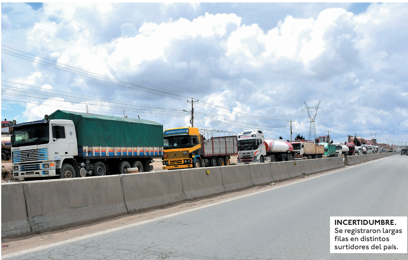
INCERTIDUMBRE. Se registraron largas filas en distintos surtidores del país.

“YA ESTAMOS EN 7 DE DICIEMBRE Y HAY BLOQUEOS. YO DIJE QUE EN DOS MESES VAMOS A INUNDAR CON COMBUSTIBLE. UNO TIENE QUE PROMETER ALGO QUE VA A CUMPLIR”.