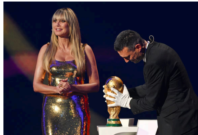
AFORTUNADO. Lionel Scaloni, seleccionador de Argentina, ingresó a la ceremonia con la Copa del Mundo.