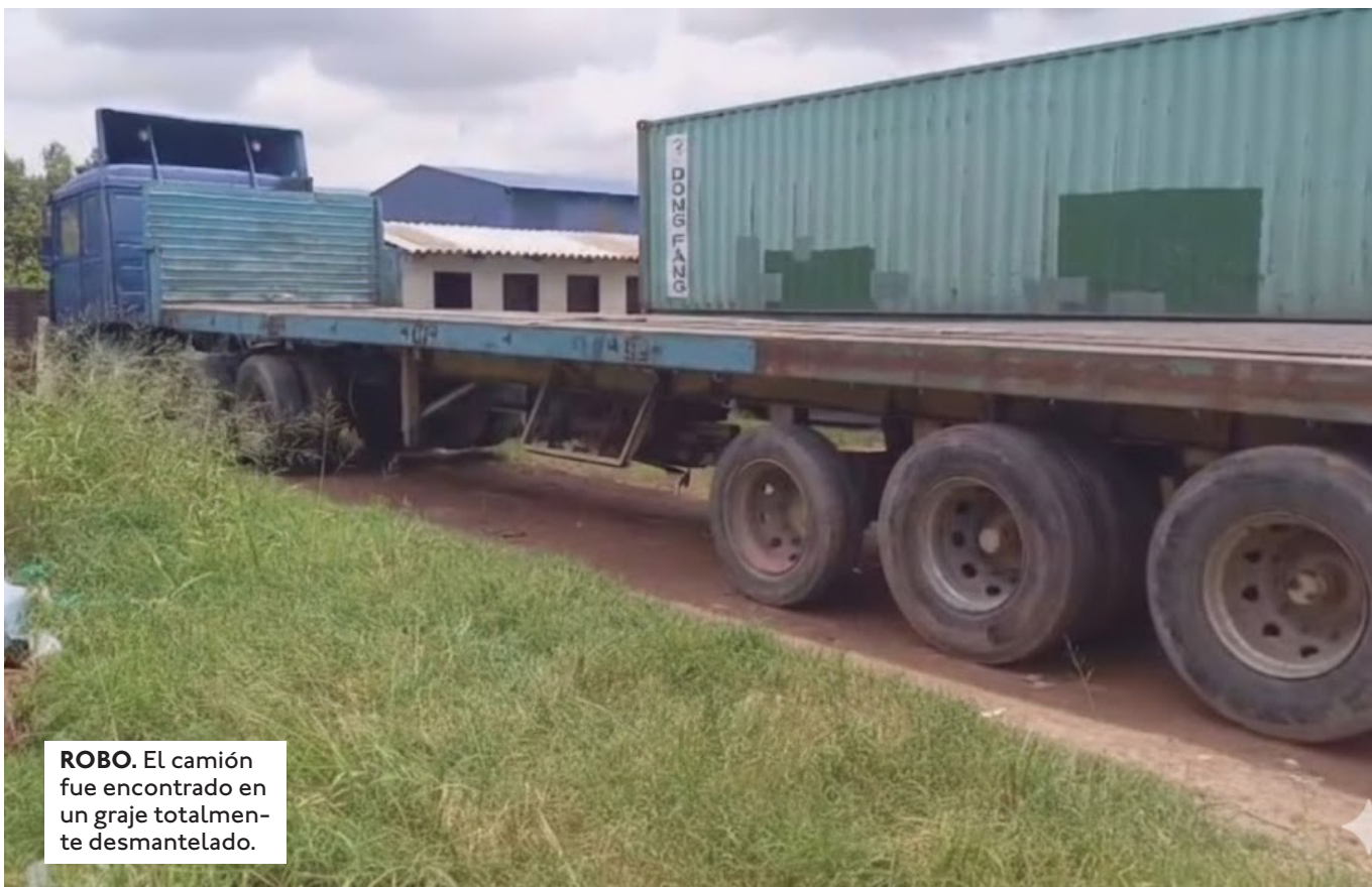
ROBO. El camión fue encontrado en un graje totalmente desmantelado.

EL HOMBRE FUE CONTRATADO POR LA DUEÑA DEL CAMIÓN PARA TRASLADAR LA CARGA DE ORURO A SANTA CRUZ. EL CHOFER ABANDONÓ EL CAMIÓN.