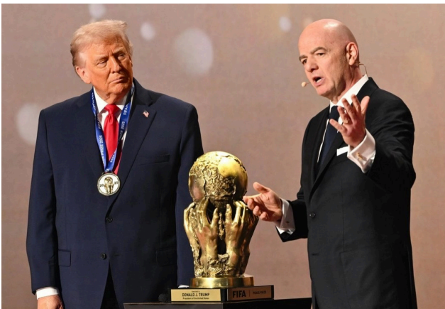
RECONOCIMIENTO. Infantino, presidente de la FIFA, entregó a Donald Trump el Premio de la Paz.