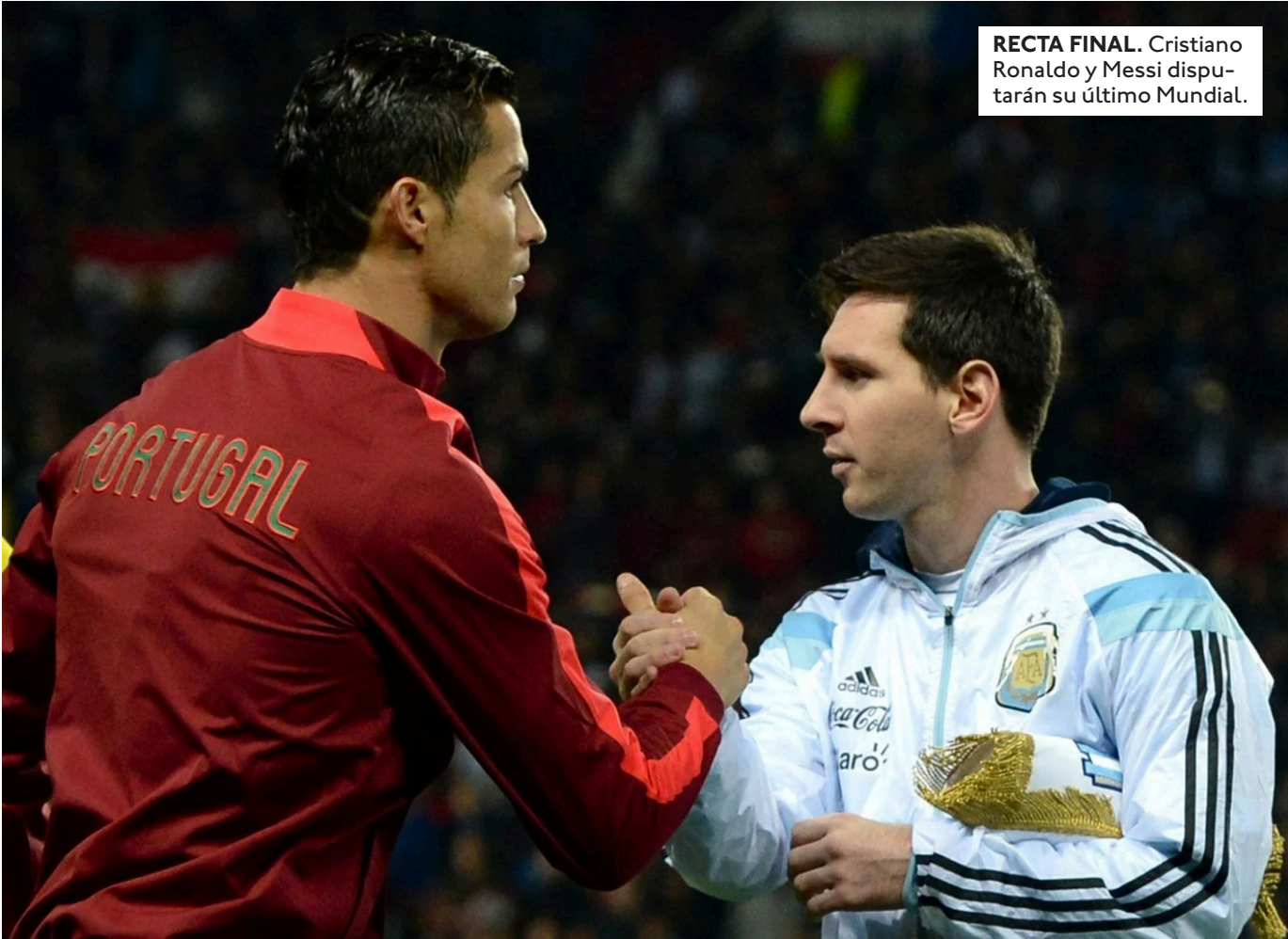
RECTA FINAL. Cristiano Ronaldo y Messi disputarán su último Mundial.

Brasil ya piensa en Marruecos "MARRUECOS HIZO UN GRAN MUNDIAL EN 2022, ES UN EQUIPO SÓLIDO, MUY BIEN ORGANIZADO", DIJO ANCELOTTI, QUE TAMBIÉN SE VERÁ CON ESCOCIA Y HAITÍ.