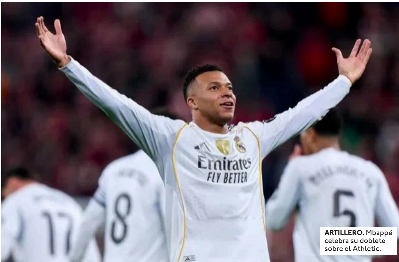
ARTILLERO. Mbappé celebra su doblete sobre el Athletic.

EL CUADRO AZULGRANA TENDRÁ UNA DURA SALIDA CUANDO ENFRENTA AL BETIS, ESTE SÁBADO A LAS 13:30. EL DOMINGO (16:00), MADRID RECIBE A CELTA DE VIGO.