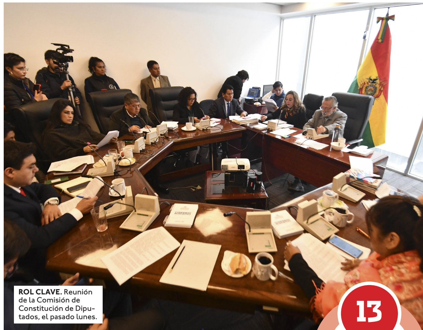
ROL CLAVE. Reunión de la Comisión de Constitución de Diputados, el pasado lunes.

Sobre la elección. Se debe aplicar la equidad de género, es decir tres