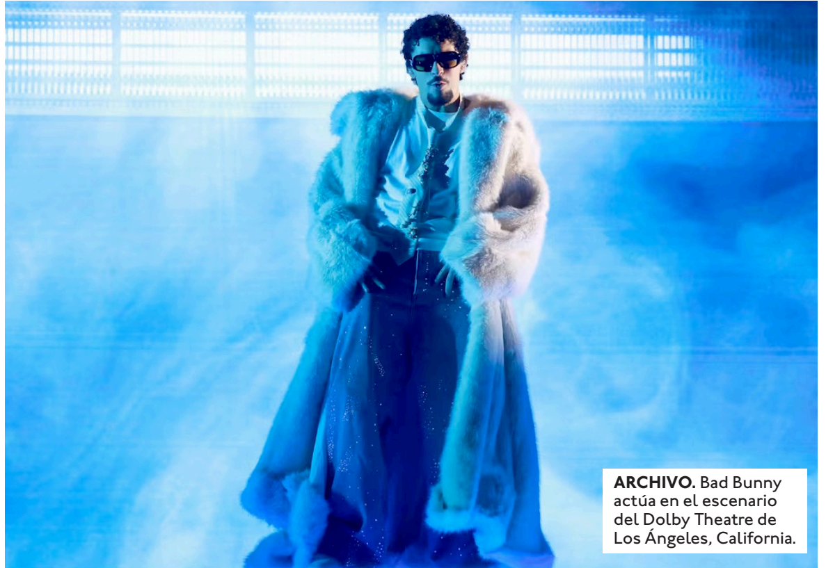
ARCHIVO. Bad Bunny actúa en el escenario del Dolby Theatre de Los Ángeles, California.

lo llevó el artista urbano. Le siguieron KPop Demon Hunters, la banda sonora de la película con el mismo nombre; Hit me hard and soft , de Billie Eilish; SOS Deluxe ; LANA , de SZA; y Short n' Sweet , de Sabrina Carpenter. El álbum de Taylor Swift quedó fuera del top 10. A la canción del puertorriqueño DtMF —que da nombre al disco— le falta poco para llegar a las 1.200 millones de reproducciones. Aun así, se posiciona en el quinto lugar de los temas más escuchados en la plataforma de streaming. El primer puesto es para Die With A