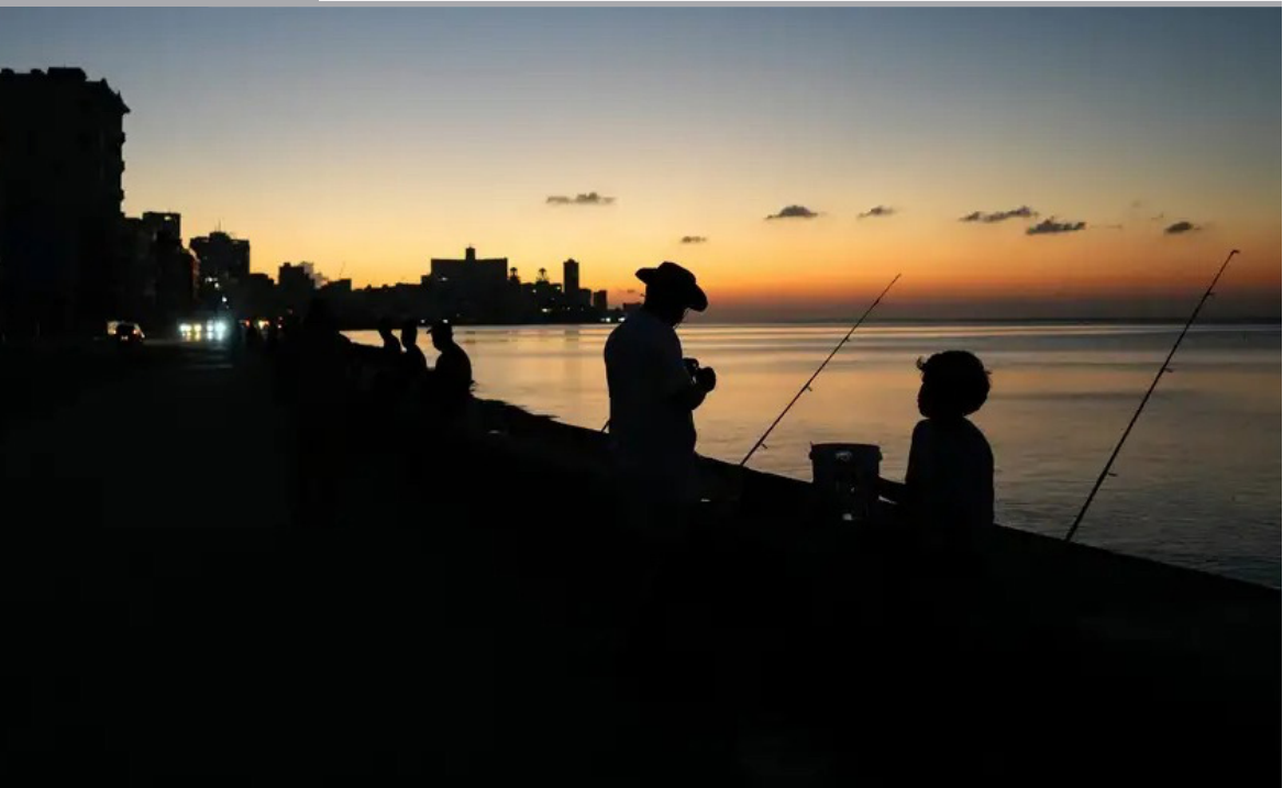
APAGÓN. La red eléctrica de Cuba colapsó parcialmente la madrugada del miércoles, dejando a oscuras La Habana y gran parte del occidente del país. Provincias como Pinar del Río, Artemisa y Mayabeque siguen sin servicio, mientras hospitales y algunos hoteles mantienen luz. La crisis energética se agrava por la escasez de combustible, infraestructura deteriorada y la reducción de importaciones clave.

Hoy los bolivianos corremos el riesgo de caer en un grado peligroso de impaciencia frente al nuevo gobierno. Ya lo vivimos antes: recuperamos la democracia en 1982, pero no supimos sostenerla con responsabilidad ni con visión de largo plazo, y en 2006 la perdimos ante el avance de un proyecto populista que se aprovechó del descontento y de nuestra urgencia por soluciones rápidas. Hemos vuelto a conquistar ese espacio democrático, frágil todavía, y debemos entender que ningún proceso de reconstrucción institucional rinde frutos de inmediato. La impaciencia acarrea muchos males: conduce a decisiones impulsivas, facilita el engaño político y debilita la capacidad colectiva de planificar. Pero su mayor consecuencia es abrirle la puerta al socialismo, que prospera allí donde la sociedad exige respuestas instantáneas y está dispuesta a creer en promesas imposibles. Si no aprendemos a sostener el esfuerzo y la maduración democrática, podemos perderla nuevamente en un abrir y cerrar de ojos.