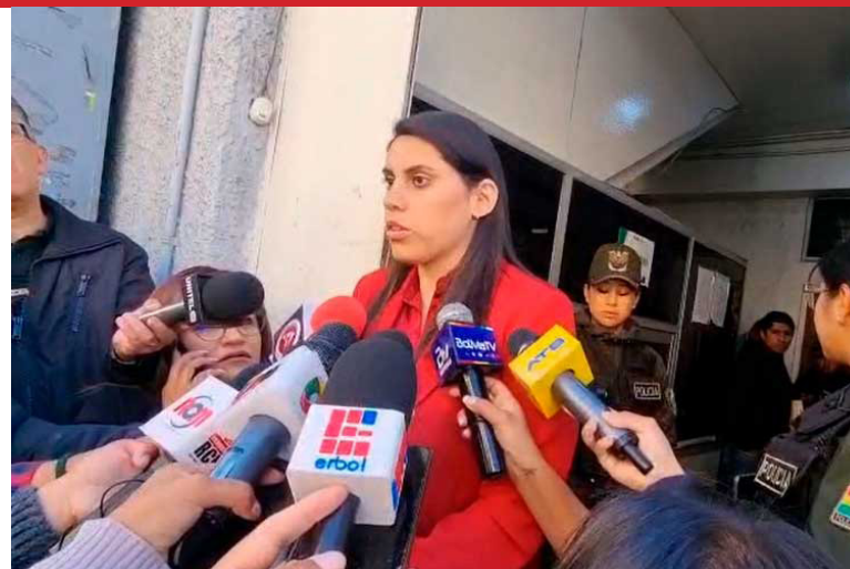
CONVOCATORIA. Barrientos se refirió al Consejo de Autonomías.

El mandatario ha ratificado al asumir el poder su intención de ajustar el manejo de los ingresos con la fórmula 50-50, la mitad en el nivel central y el resto en las entidades subnacionales. / ED - Urgente