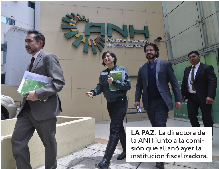
LA PAZ. La directora de la ANH junto a la comisión que allanó ayer la institución fiscalizadora.

por ciento del combustible subvencionado se desvía, según el gobierno.