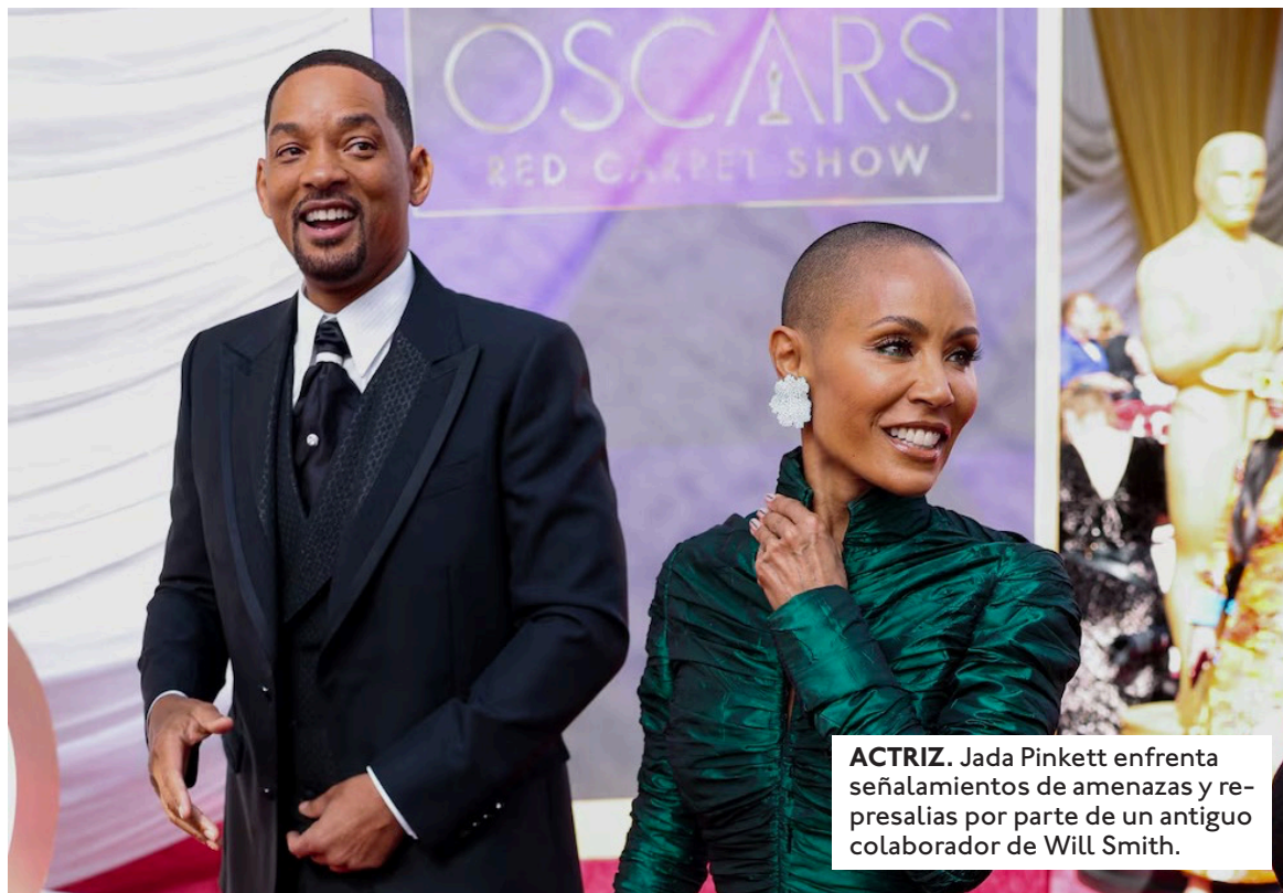
ACTRIZ. Jada Pinkett enfrenta señalamientos de amenazas y represalias por parte de un antiguo colaborador de Will Smith.