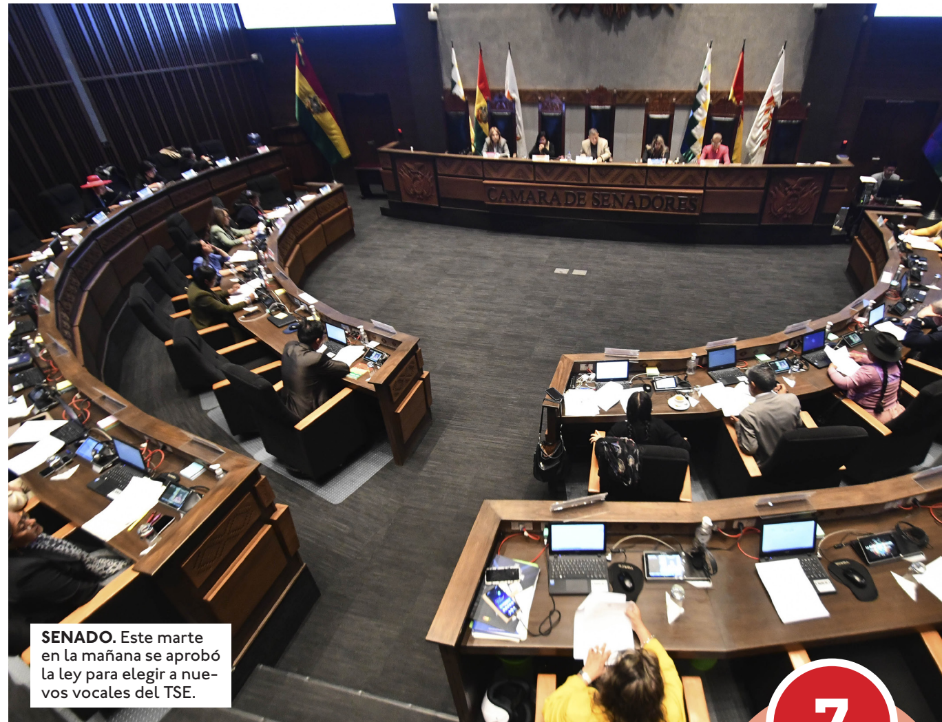
SENADO. Este martes en la mañana se aprobó la ley para elegir a nuevos vocales del TSE.

La norma tiene en total 41 artículos y cinco disposiciones finales. Uno de los compromisos al aprobar la ley está referido también al padrón electoral. "Algo muy importante que también se aprobó es el hecho de que, en dos años, se va a tener un padrón electoral