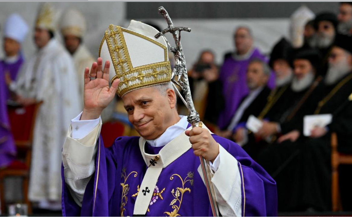
LÍBANO. El papa León XIV concluyó este martes su visita al Líbano con una misa multitudinaria en el paseo marítimo de Beirut, donde más de 150.000 fieles lo recibieron entre banderas y plegarias. En su mensaje final, llamó al país a ser “morada de justicia y fraternidad”, y pidió abandonar la violencia y abrir nuevos caminos de reconciliación y paz en Oriente Medio.

Un reciente informe de la OMS deja claro lo que en Bolivia muchos prefieren ignorar: la hoja de coca sigue siendo una puerta abierta al narcotráfico y un problema de salud pública. No basta repetir que es “tradicional” mientras el país vive un libertinaje total en producción, consumo y desvío hacia la cocaína. El acullico masivo, promovido como inocuo, está generando trastornos de salud y alimentando dinámicas sociales dañinas. Y frente a eso, el gobierno no debe actuar con tibieza, lo que equivale a no permitir más coca de la que el país necesita, no tolerar zonas donde no hay control real y tampoco usar el discurso cultural para esquivar responsabilidades. La sociedad también debe asumir lo suyo, pues todavía normaliza el exceso, romantiza la práctica y mira para otro lado ante el avance del narcotráfico. El mensaje de la OMS no admite doble lectura: Bolivia debe ordenar su producción, frenar el descontrol, recuperar la autoridad del Estado y discutir sin excusas el impacto real de la coca en la salud y en la convivencia.