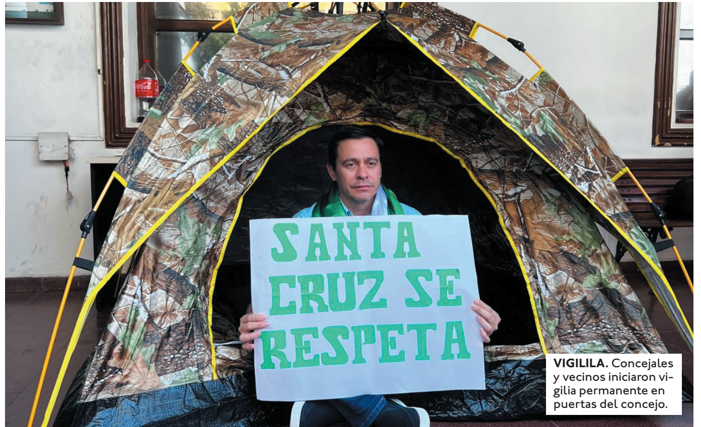
VIGILIA. Concejales y vecinos iniciaron vigilia permanente en puertas del concejo.

EL ALCALDE JHONNY FERNÁNDEZ, ADVIRTIÓ QUE, DE SER NECESARIO, ENVIARÁ EL DOCUMENTO DIRECTAMENTE AL MINISTERIO DE ECONOMÍA MEDIANTE DECRETO EDIL.