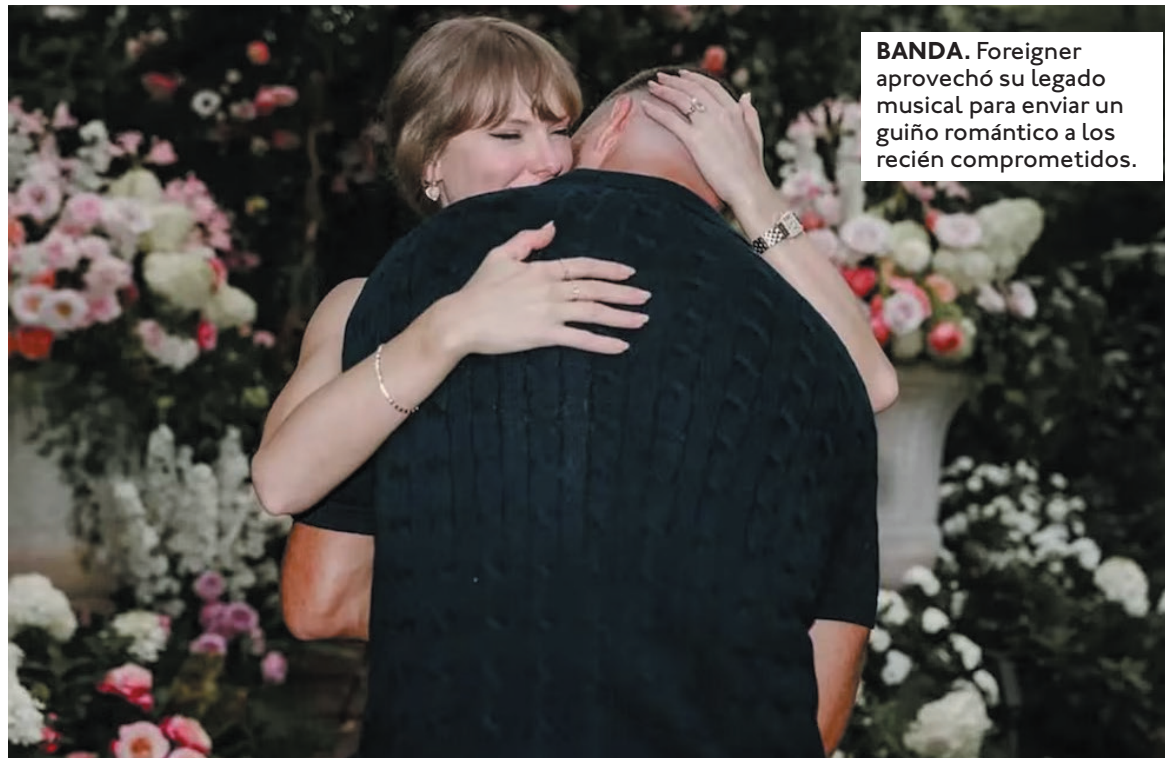
BANDA. Foreigner aprovechó su legado musical para enviar un guiño romántico a los recién comprometidos.

El romántico compromiso de Swift y Kelce. Taylor Swift, de 35 años, y Travis Kelce, también de 35, anunciaron su compromiso el 26 de agosto con un romántico post conjunto en Instagram. En las imágenes, tomadas en un jardín adornado con flores, podía verse el momento especial de la