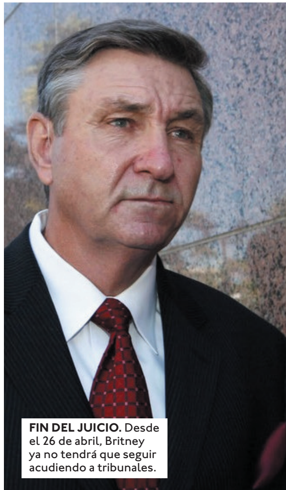
FIN DEL JUICIO. Desde el 26 de abril, Britney ya no tendrá que seguir acudiendo a tribunales.

"Desde que obtuvo su libertad, a finales de 2021, Britney Spears ha logrado un éxito notable en varios frentes, incluida su colaboración