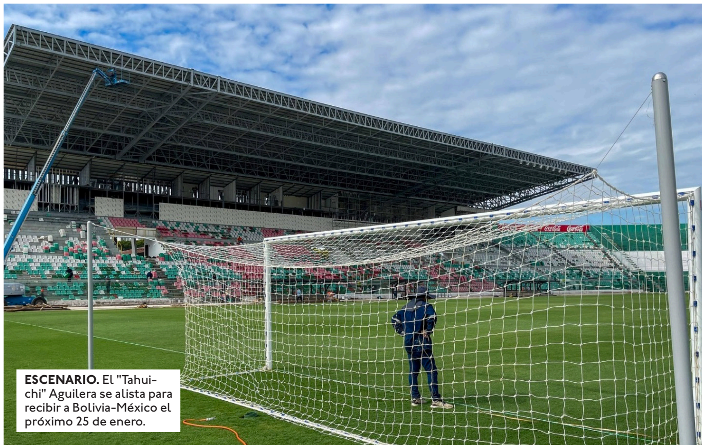
ESCENARIO. El "Tahuichi" Aguilera se alista para recibir a Bolivia-México el próximo 25 de enero.

LA SELECCIÓN TENDRÁ SU ÚLTIMO EN- TRENAMIE- TO EN SANTA CRUZ ESTE SÁBADO POR LA MAÑANA. LUEGO VIAJA A TARIJA PARA EL PARTIDO DEL DOMIN- GO ANTE PANAMÁ.