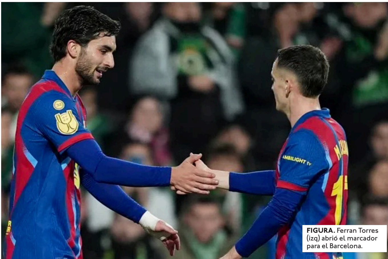
FIGURA. Ferran Torres (izq) abrió el marcador para el Barcelona.

TRAS LA CLASIFICACIÓN, EL AZULGRANA SE ALISTARÁ PARA VISITAR A LA REAL SOCIEDAD POR LA FECHA 20 DE LA LIGA. EL DUELO SERÁ ESTE DOMINGO A LAS 16:00.