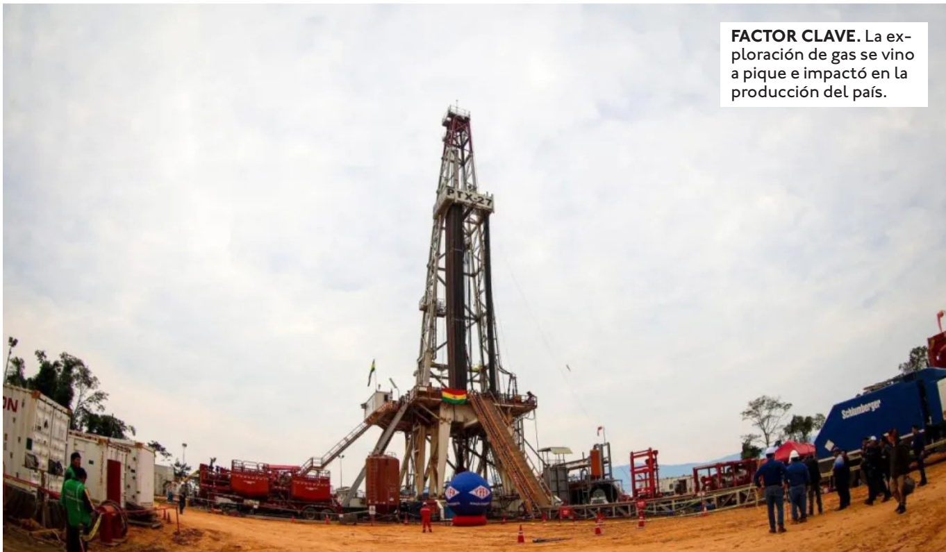
FACTOR CLAVE. La exploración de gas se vino a pique e impactó en la producción del país.

EL GOBIERNO DEBÍA PRESENTAR INICIALMENTE EL PGE REFORMULADO EN FEBRERO, LUEGO LO DEJÓ PARA MARZO Y AHORA MANEJAN DEL DATO DE EN LAS PRÓXIMAS DOS SEMANAS.