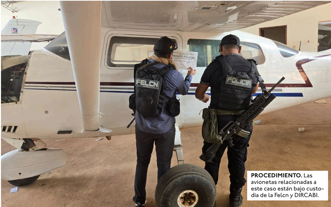
PROCEDIMIENTO. Las avionetas relacionadas a este caso están bajo custodia de la Felcn y DIRCABI.

EL FISCAL DEPARTAMENTAL ALBERTO ZEBALLOS DIJO QUE ESOS CAMBIOS PERMITEN SOSPECHAR EL POSIBLE USO ILÍCITO DE LAS AERONAVES.