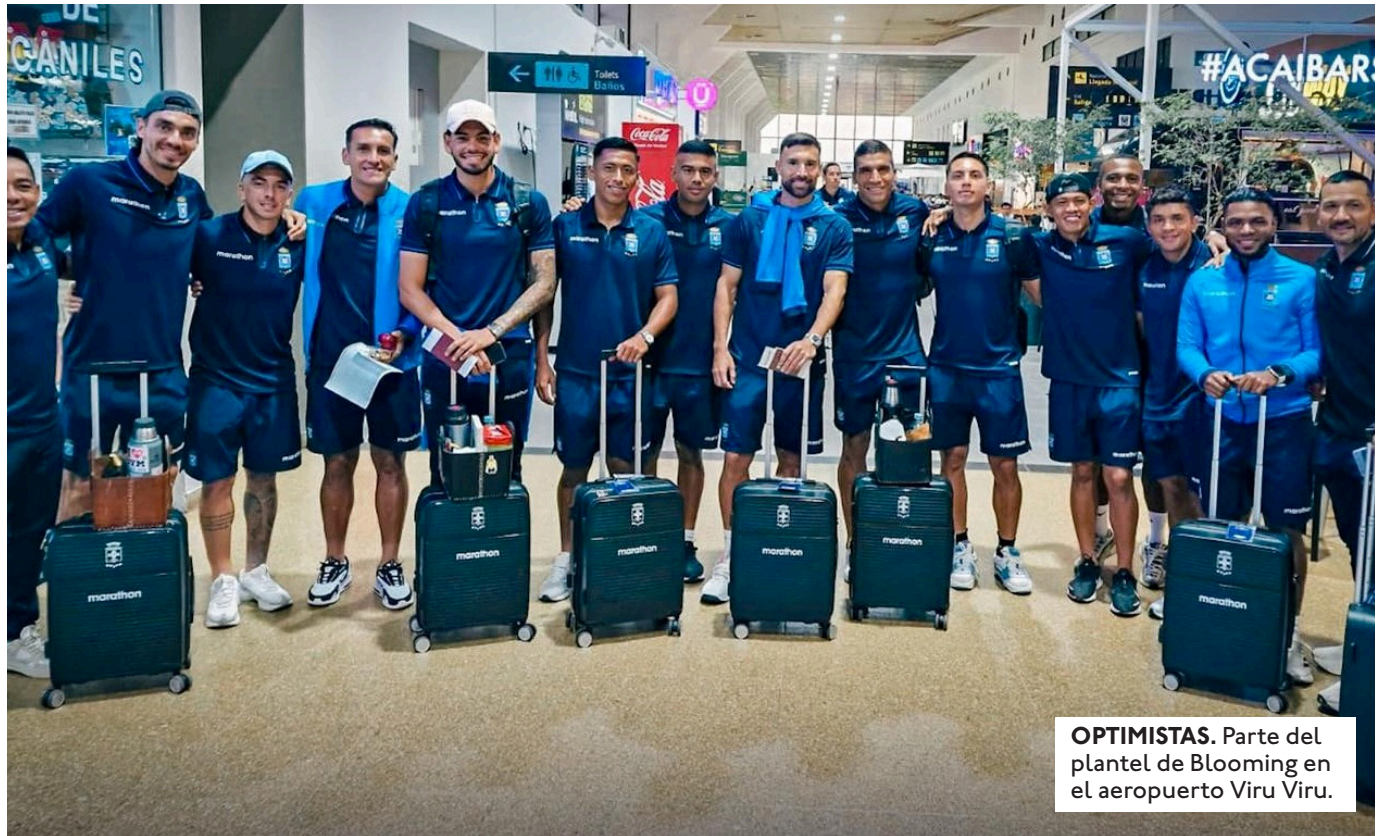
OPTIMISTAS. Parte del plantel de Blooming en el aeropuerto Viru Viru.

EL TDD SANCIONÓ CON DOS PARTIDOS AL JUGADOR DE GUABIRÁ MÁS UNA MULTA ECONÓMICA TRAS EXPULSIÓN. BLOOMING, CON CINCO SALARIOS MÍNIMOS TRAS PIROTECNIA.