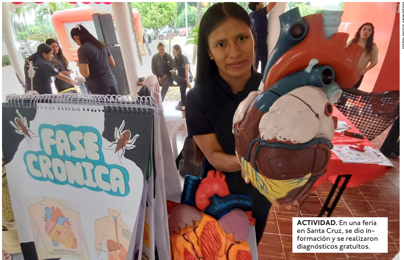
ACTIVIDAD. En una feria en Santa Cruz, se dio información y se realizaron diagnósticos gratuitos.