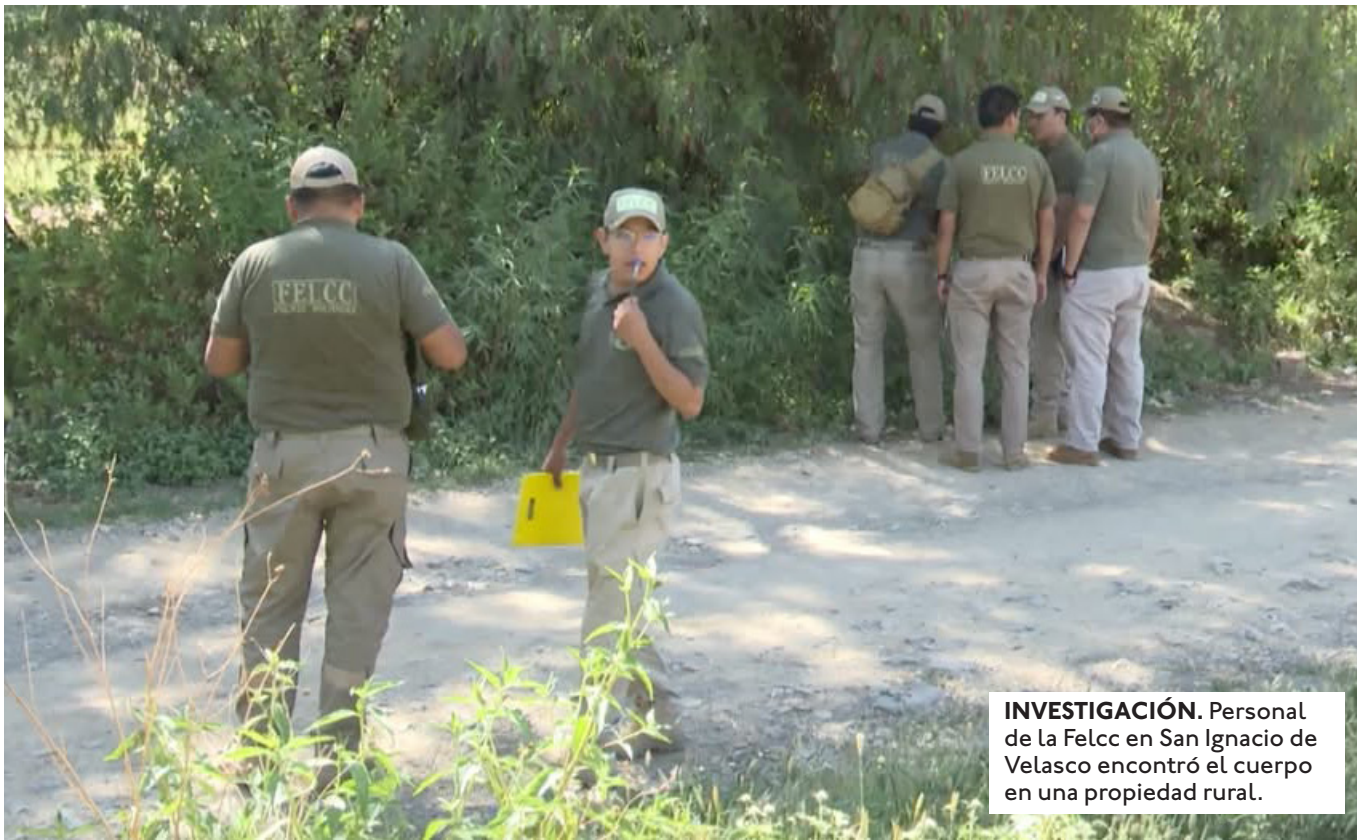
INVESTIGACIÓN. Personal de la Felcc en San Ignacio de Velasco encontró el cuerpo en una propiedad rural.

EL SÁBADO 11 DE ABRIL, EN SAN IGNACIO UN CIUDADANO BRASILEÑO PERDIÓ LA VIDA CON VARIOS IMPACTOS DE BOLA AL INTERIOR DE UNA FLOTA.