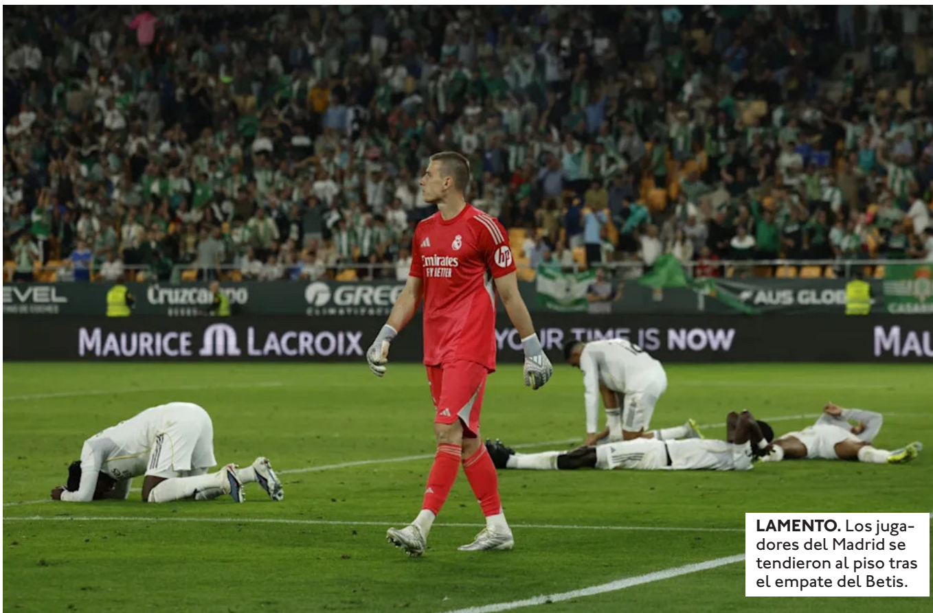
LAMENTO. Los jugadores del Madrid se tendieron al piso tras el empate del Betis.